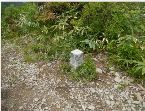
五郎岳山頂の三角点です