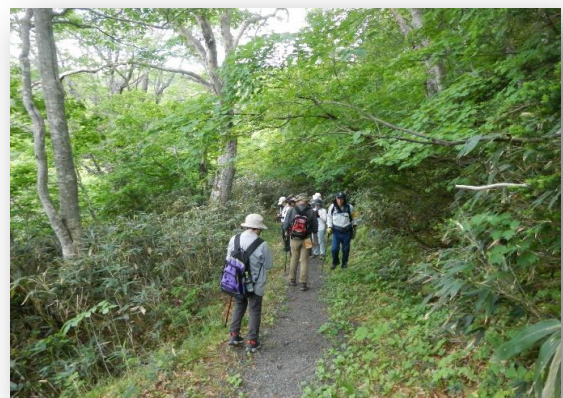
片貝沼から五郎岳に向かうコースにてチラシ配布