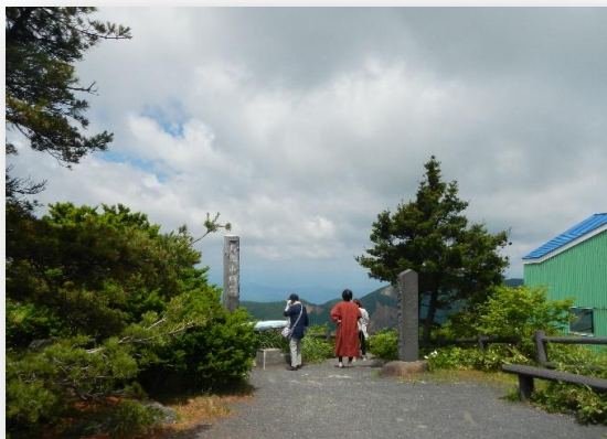
鳥兜山頂からの見晴らしは良好です