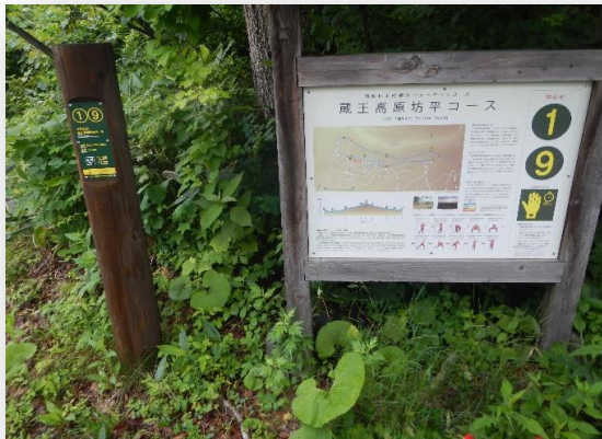
クアオルトコースの案内看板です