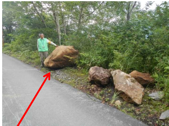
蔵王林道の落石箇所、金網を破って大きな落石があった模様