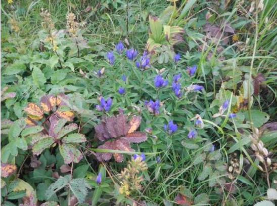
8月中旬を過ぎてエゾオヤマリンドウが咲き始めました

蔵王RWにて地藏山頂駅へ。観光客、登山者は少ない。 しばらく待ったが天候は回復せず、ザンゲ坂から樹氷減コースを巡視下山。 昼食後、蔵王林道、中央散策路を巡視。 蔵王林道中頃に、大きな落石があった模様(先週の大雨か?)