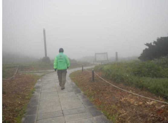
地藏山頂付近、天候は回復しない