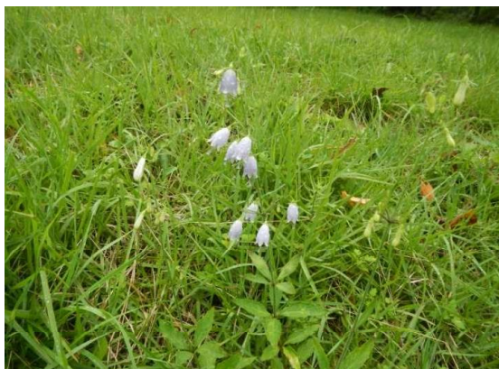
坊平のツリガネニンジン