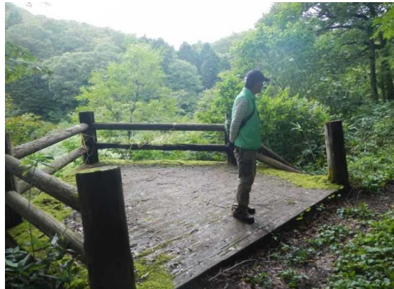
中央散策路メダマ沼展望台、壊れています。