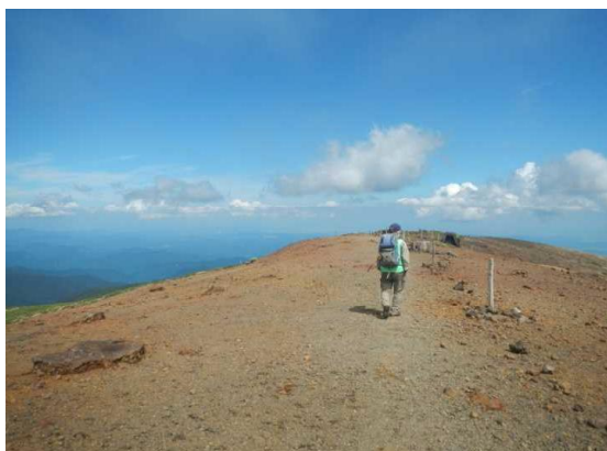
14時頃は天候回復(熊野十字路)