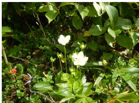
祓川コースのウメバチソウ