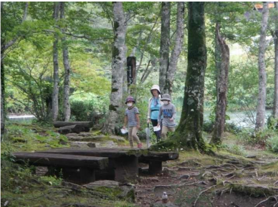
ドッコ沼付近、親子ずれの散策者(スタンプラリー中)