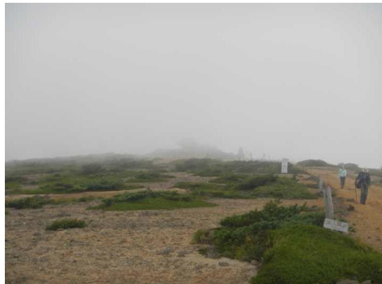
昼前の熊野岳山頂