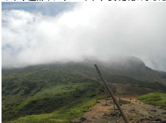
地藏山より熊野岳方面

地藏山頂駅より熊野岳へ向かう。昼前後は登山者20~25名(群馬、福島、新潟など) 13時頃まで曇っていたが、14時すぎには回復。祓川コースを巡視下山。 ワサ小屋跡下にウメバチソウも咲き始めました。