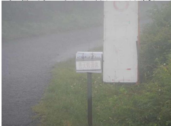
悪天候のため刈田リフトは運休

刈田岳に向かいましたが、山の上は大荒れでした。30分ほど待機、坊平に下山しました