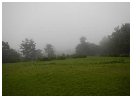
坊平でも天候回復せず