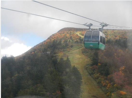
三宝荒神山 ロープウェイから