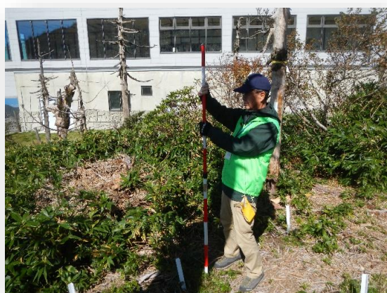
オオシラビソ幼樹調査(幼樹位置確認)