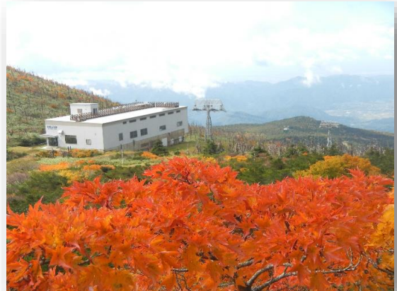
三宝荒神山からの紅葉