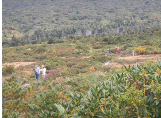
散策者が多かった。