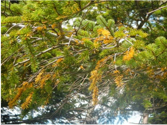
アオモリドマツの先端部が一部黄変

蔵王RWのメンテナンスが終了。地蔵山頂駅に向かいました。 三宝荒神山を巡視した後、樹氷減コースを下り、アオモリドマツの食害の調査をしました。 アオモリドマツは葉の一部が黄変していましたが、害虫は見かけませんでした。(一部サンプル) 途中、山大の観察グループと山形森林管理署の皆さんと遭遇しました。 午後からは蔵王林道巡視を行いました。