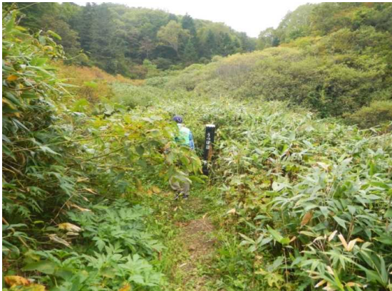
中央散策路ウツボ沼付近