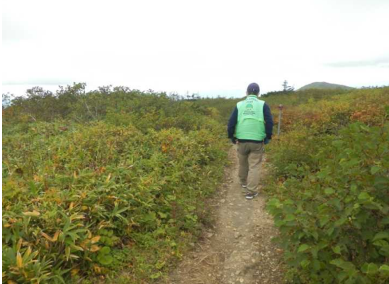
御田神湿原巡視に向かう

強風で刈田リフトが停止中。待機するも回復せず、御田神湿原に向かう。 馬の背を中止して御田の神湿原に回った散策者が多く、14～6名ほど。(長野、宮城、山形) 昼食後蔵王林道巡視。 一部紅葉が始まって、散策者が多くなっています。五郎岳に向かう登山者が5名。