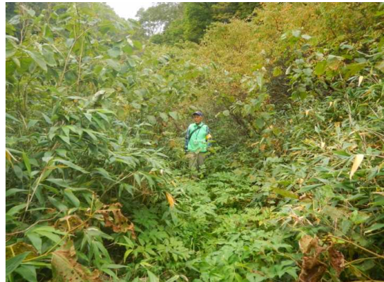
ウツボ沼付近は一部藪漕ぎ