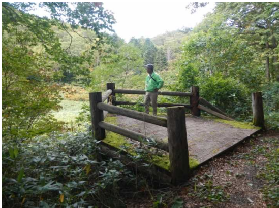
中央散策路 メダマ沼付近