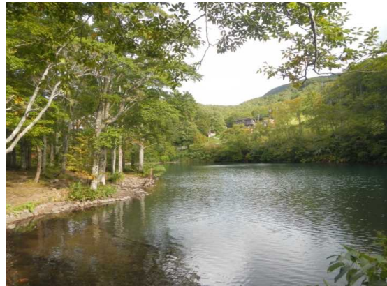
15時過ぎのドッコ沼 散策者はなし