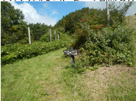
龍山登山道入り口

中央RWIにてドッコ沼経由、龍山巡視。 久しぶりの龍山登山道は整備され歩きやすかった。前後4名ほどの登山者がいました。 アップダウンがきつく、一部ロープ箇所があり、タフなコースでした。