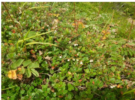
登山道横のシラタマノキ

★8月23日 地蔵山頂駅から熊野岳山頂を巡視。午後からは祓川コースを下り樹氷高原駅。