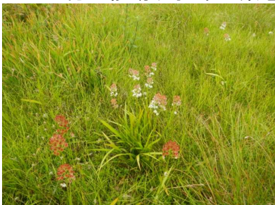
御田神湿原のイワショウブ