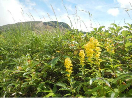
祓川コースのミヤマアキノキリンソウ