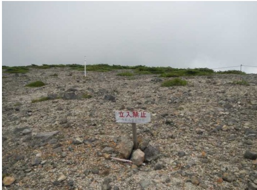
立札の移動(向こうは緊急避難路)