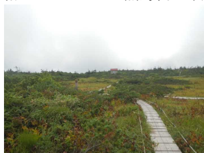
御田神湿原の木道

★8月23日 地蔵山頂駅から熊野岳山頂を巡視。午後からは祓川コースを下り樹氷高原駅。