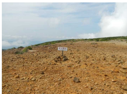
熊野十字路付近で立札移動