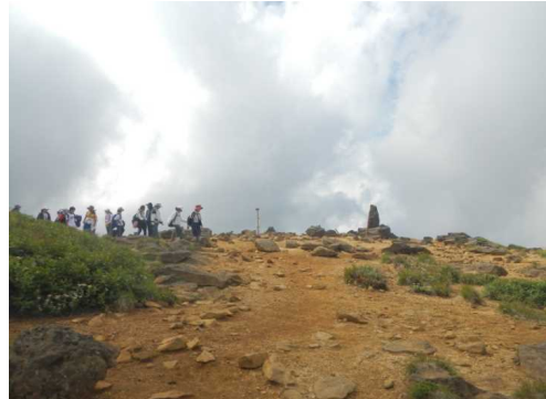
熊野岳山頂の小学生グループ