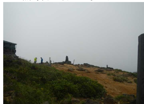
熊野岳山頂も雨模様

★9月12日 刈田岳～移動、悪天候のため、刈田リフト運休。蔵王坊平に移動し、クロカンコースなど巡視。