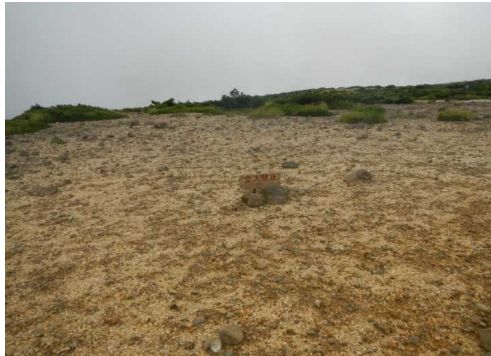
馬の背にタテフダ設置