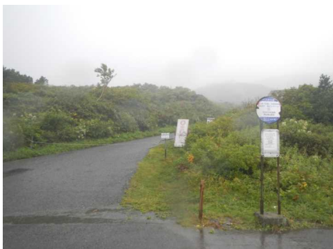
刈田リフトは悪天候運休