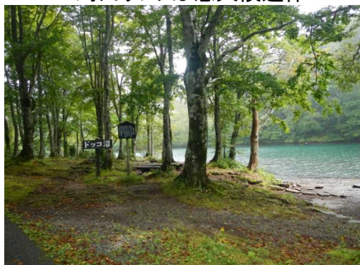
ドッコ沼は散策者ゼロ。