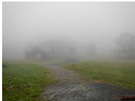
パラダイス付近(霧 視界20m程)