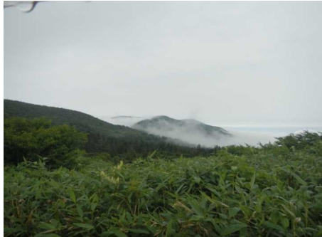
刈田駐車場から南蔵王方面