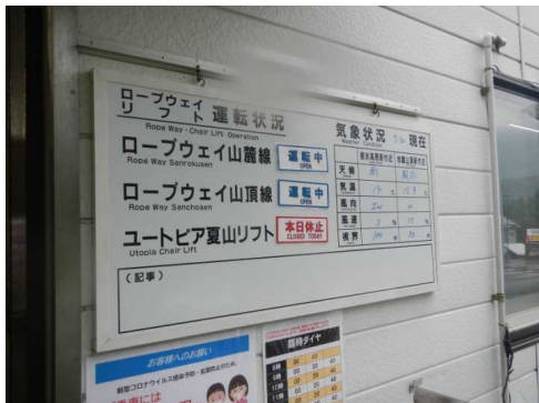
蔵王ロープウェイ入口