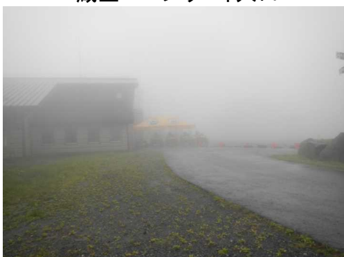
スカイケーブル山頂駅