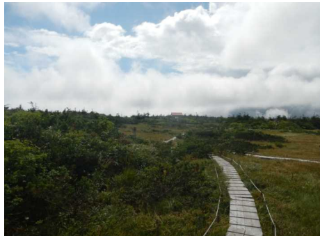
晴れ間の御田神湿原