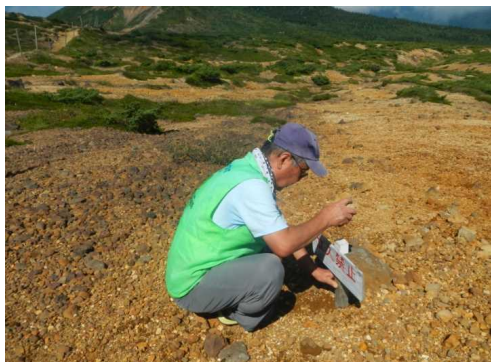
タテフダ設置(熊野十字路)

★9月6日 地蔵山頂駅から熊野岳を巡視。午後から祓川コースを巡視。晴れ。 立入禁止のタテフダ2本設置。サンダル、ローヒールの観光