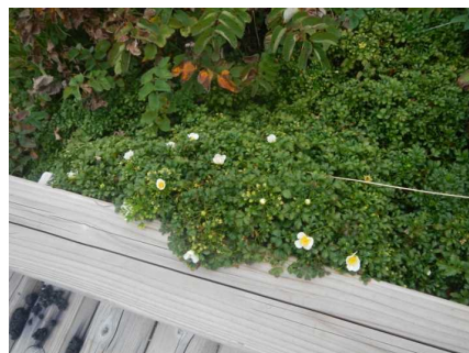
時季外れのチングルマ