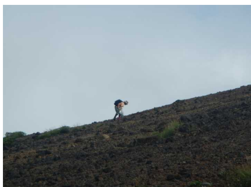
蔵王町のゴミ拾いチーム