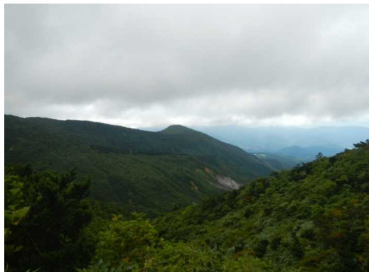
祓川コース下山、天候は下り気味