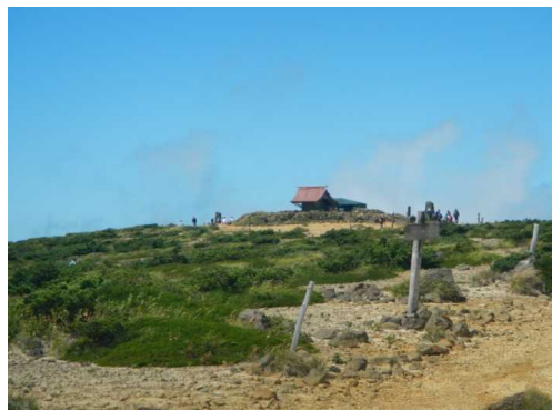
昼前の熊野岳山頂