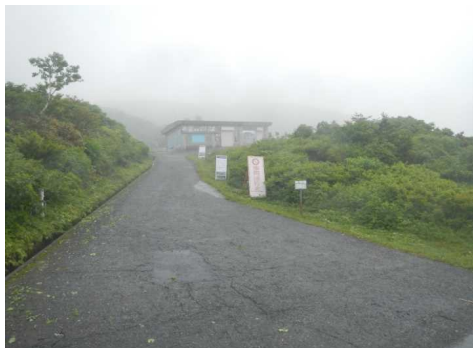
刈田リフトは運休