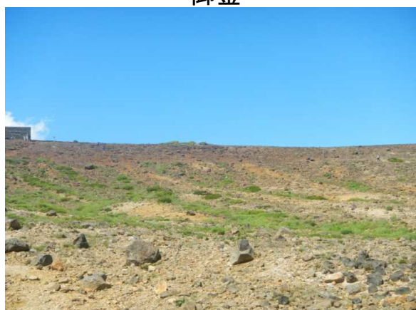
熊野十字路、コマクサ散策者