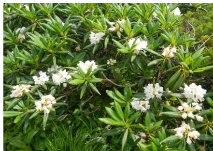
三宝荒神山のハクサンシャクナゲ