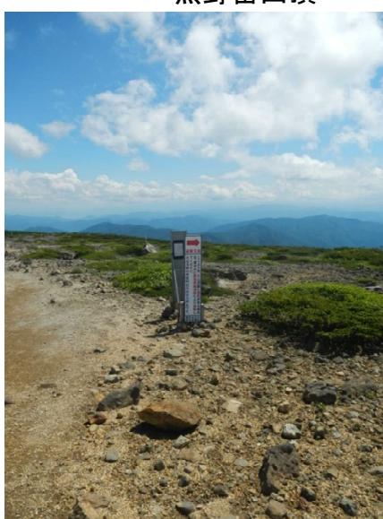
緊急避難路の矢印が道案内。