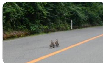
横断中のカルガモ