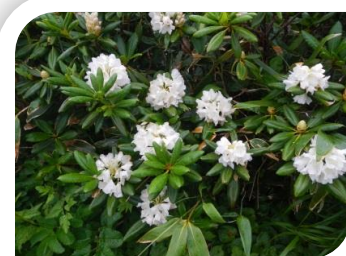
ハクサンシャクナゲ