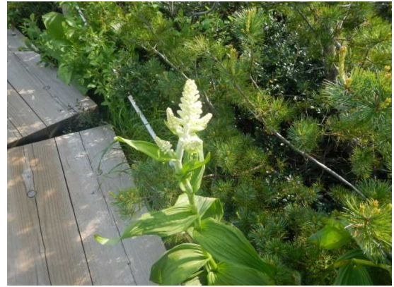
イロハ沼のコバイケイソウ

6月24日 曇り、刈田P付近は時々小雨。気温18℃ 御田神湿原巡視。散策者が多数おりました。仙台方面からのツアー10名、他5組×2人。 写真撮影と高山植物の観察。散策者に説明をしました。 午後からは坊平にてクアオルト散策コースの巡視をしました。散策者はいませんでした。 野営場には、多くの方がキャンプをしていました。