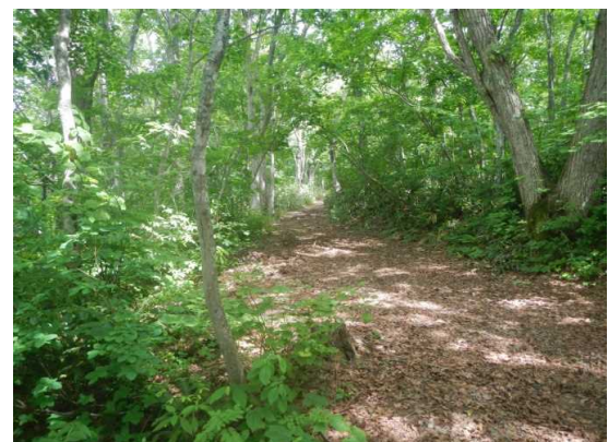
クアオルト散策コース