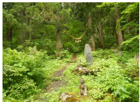
お清水の森登山道入り口