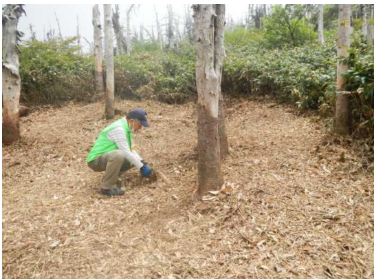
植栽予定地の後片付け

6月22日 晴 気温18℃ 微風 午前中、山形署にて月末ミーティング。定時報告と安全指導外 地蔵山山頂駅周辺の巡視、オオシラビソ植栽予定地の後片付け。 昼食後祓川コースを下山巡視。