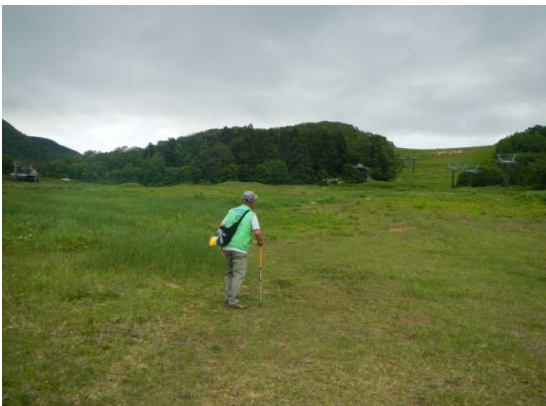
クアオルト散策コースお清水森方面へ