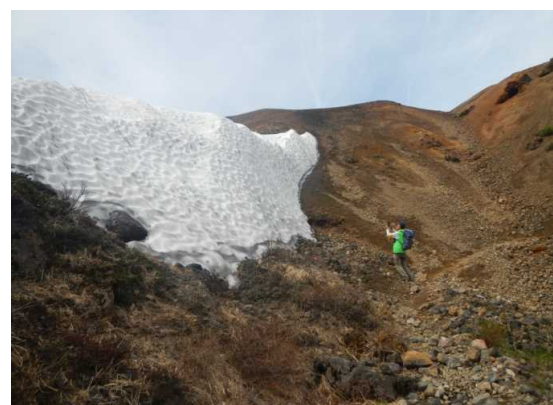
祓川コースの残雪