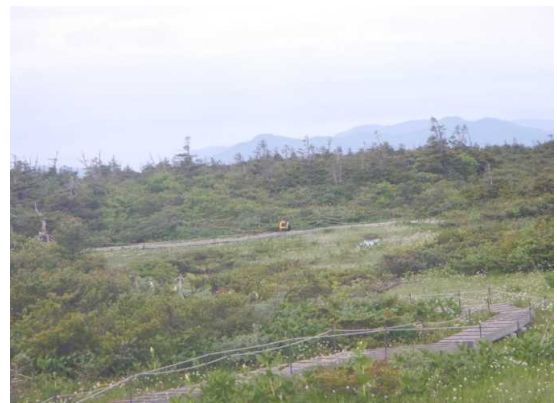
御田神湿原の散策者