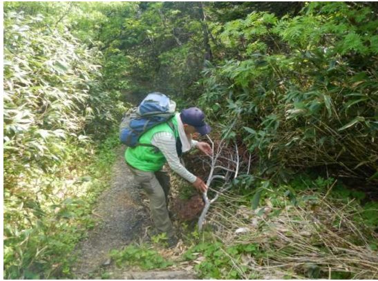
コース上障害物の撤去