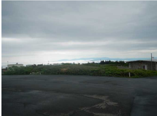
刈田P付近は曇りで天候悪い

6月24日 曇り、刈田P付近は時々小雨。気温18℃ 御田神湿原巡視。散策者が多数おりました。仙台方面からのツアー10名、他5組×2人。 写真撮影と高山植物の観察。散策者に説明をしました。 午後からは坊平にてクアオルト散策コースの巡視をしました。散策者はいませんでした。 野営場には、多くの方がキャンプをしていました。