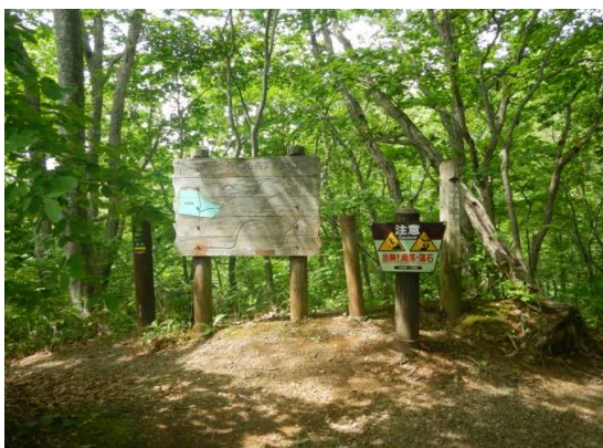
中丸山登山道入り口