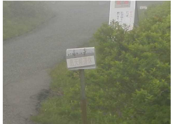
刈田リフトは運休