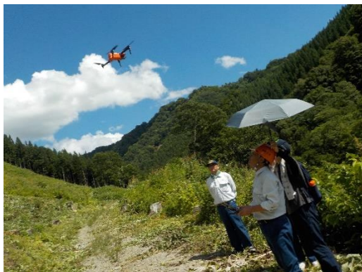
ドローンによる境界巡視（東根市）