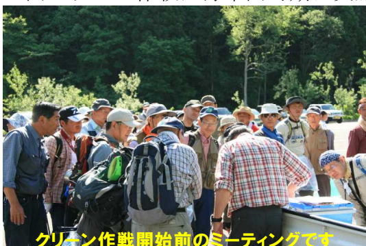
クリーン作戦開始前のミーティングです