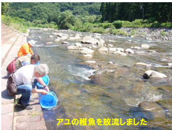
アユの稚魚を放流しました

平成26年6月22日（日）に「白神山地と赤石溪流の観光を考える会」の本年の主事業である観光資源マップ作成のため赤石川上流域白神ラインに係る観光資源の現地調査・視察が行われ当センターからも職員が参加しました。