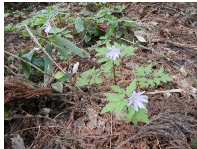
○キクザキイチリンソウ