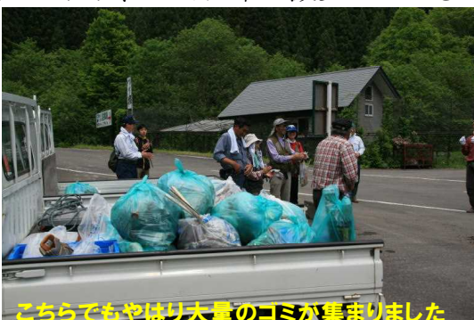
こちらでもやはり大量のゴミが集まりました