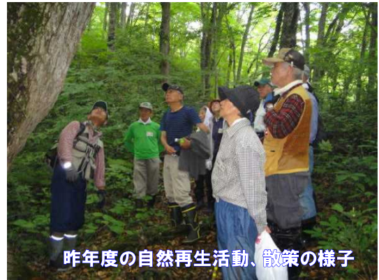
昨年度の自然再生活動、散策の様子

間もなく梅雨も明けようかという時期になりましたが、今春、赤石溪流沿いで見かけた春の花々をご紹介します。