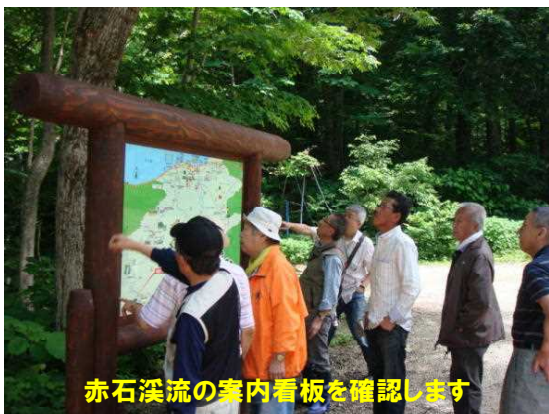
赤石溪流の案内看板を確認します