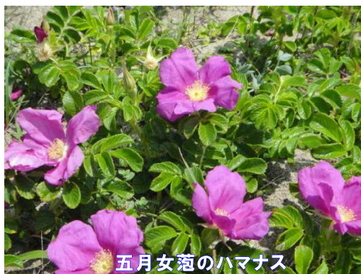
五月女冠のハマナス