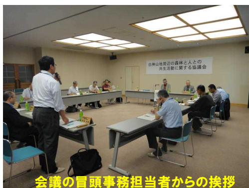
会議の冒頭事務担当者からの挨拶

6月24日（火）弘前市の青森県武道館で、第9回目の「白神山地周辺の人と森との共生活動に関する協議会」を開催しました。