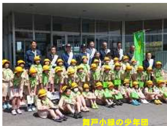
舞戸小緑の少年団