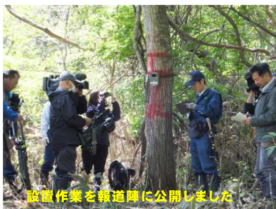
設置作業を報道陣に公開しました

近年青森県内で目撃情報が増加しているニホンジカの分布状況を把握するため、昨年度に引き続き5月14日（木）よりセンサーカメラの設置作業を開始しました。