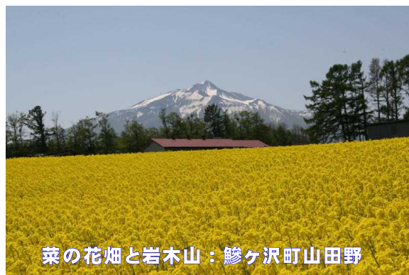
菜の花畑と岩木山：鯨ヶ沢町山田野