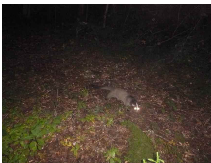
ハクビシン (調査地13:平成28年9月25日撮影)