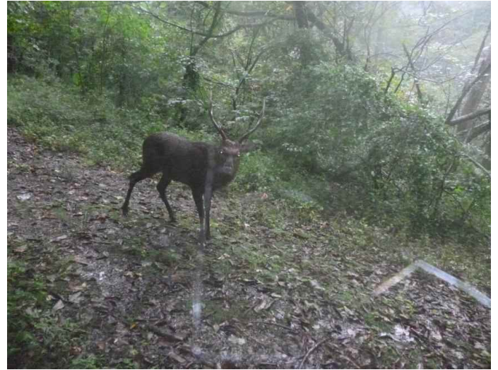
調査地8: 平成28年10月8日 11時46分撮影