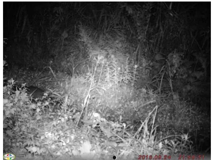
不明哺乳類 (調査地4:平成28年9月24日撮影)