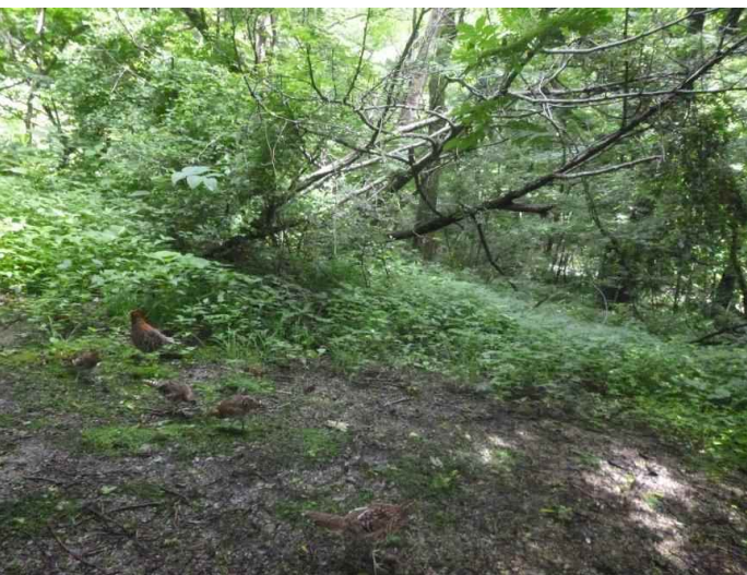
ヤマドリ (調査地8:平成28年7月15日撮影)