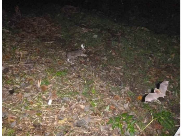
ニホンノウサギ・不明コウモリ類 (調査地1:平成28年10月23日撮影)