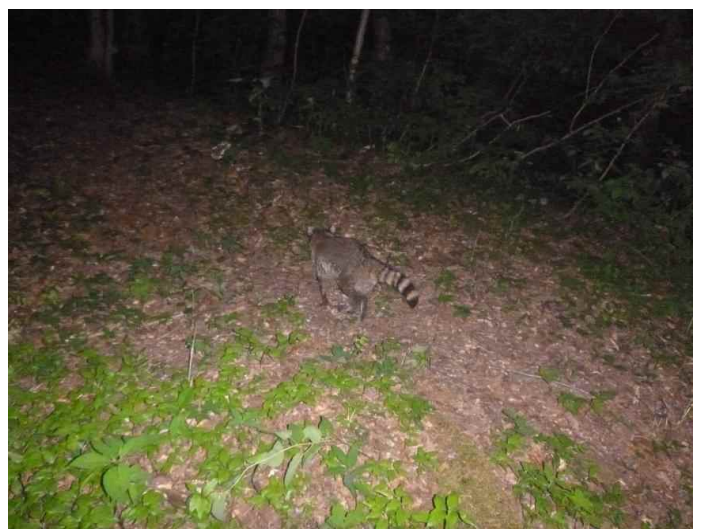
アライグマ (調査地13:平成28年5月25日撮影)