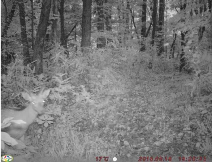
調査地6: 平成28年6月18日 19時25分撮影