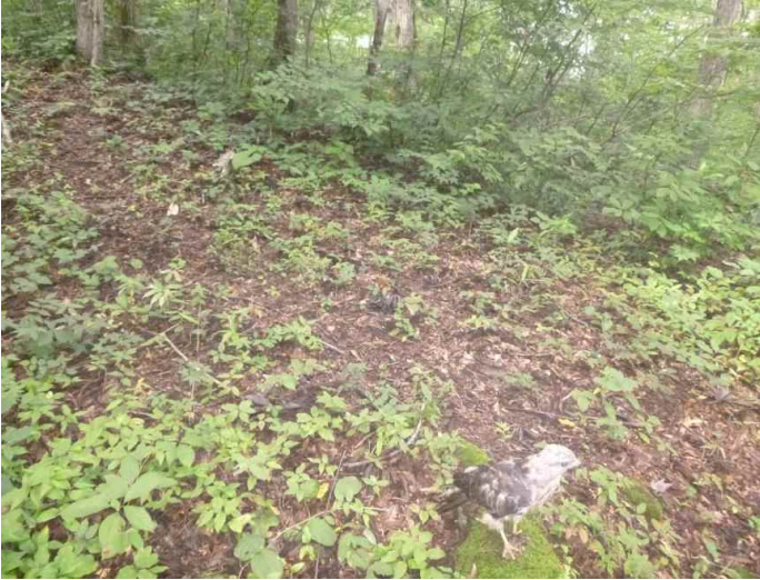
ノスリ (調査地13:平成28年8月16日撮影)