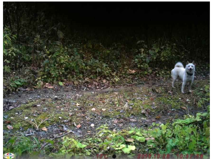
イヌ (調査地19:平成28年10月28日撮影)