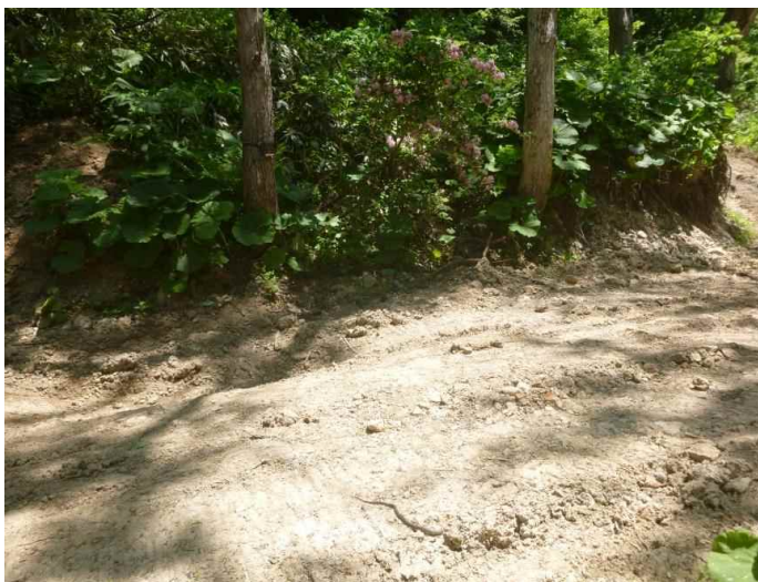
ヤマカガシ (調査地15:平成28年5月30日撮影)