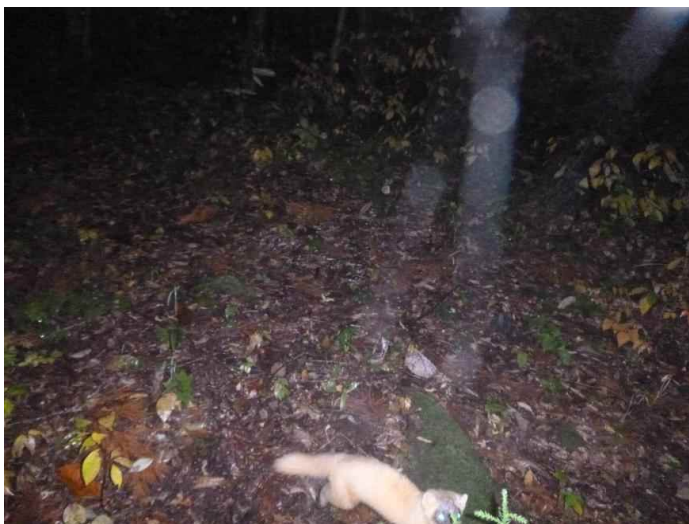
テン (調査地13:平成28年10月23日撮影)