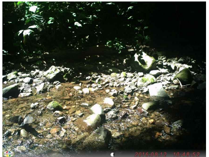
キジバト (調査地10:平成28年8月12日撮影)