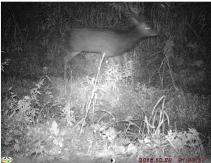
調査地4: 平成28年10月20日 1時6分撮影