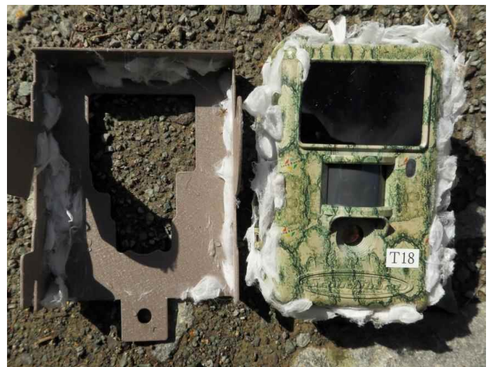
クモ類営巣状況 (平成28年10月7日撮影)