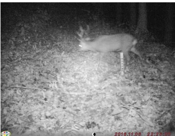
調査地7: 平成28年11月6日 22時26分撮影