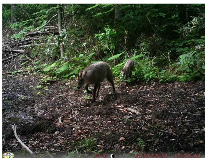
カモシカ (調査地14:平成28年6月12日撮影)