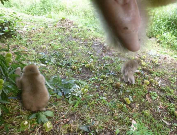
ニホンザル (調査地1:平成28年9月14日撮影)