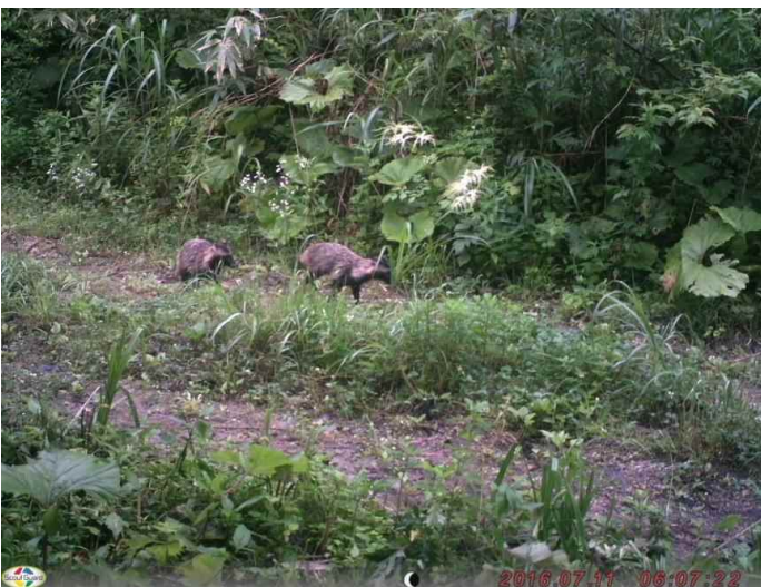
タヌキ (調査地4:平成28年7月11日撮影)