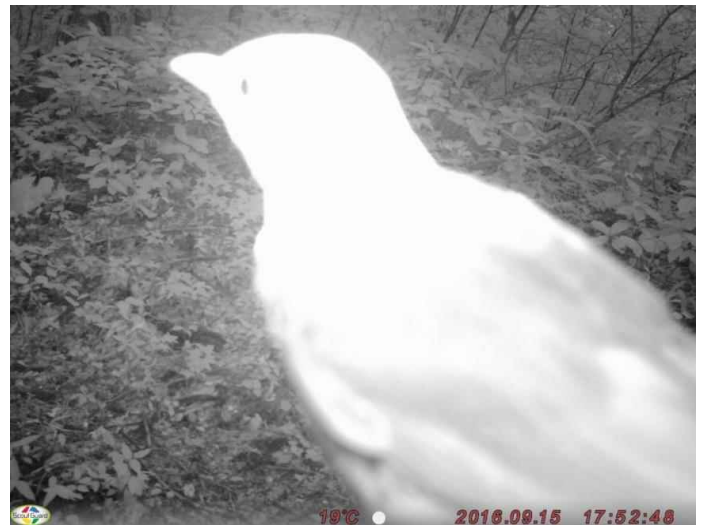
不明鳥類 (調査地13:平成28年9月15日撮影)