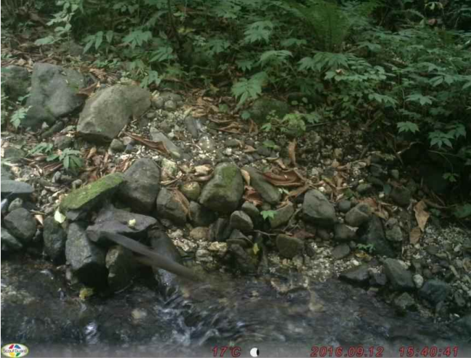
ニホンリス (調査地20:平成28年9月12日撮影)