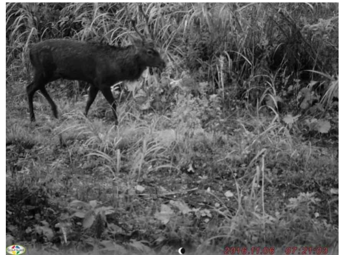
調査地4: 平成28年11月6日 7時21分撮影