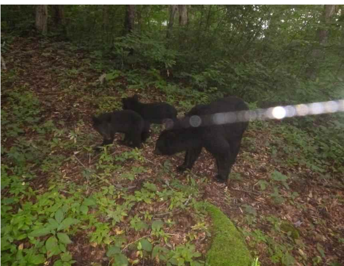
ツキノワグマ (調査地13:平成28年8月22日撮影)