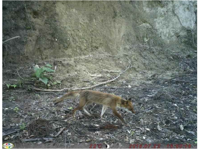
キツネ (調査地17:平成28年7月22日撮影)