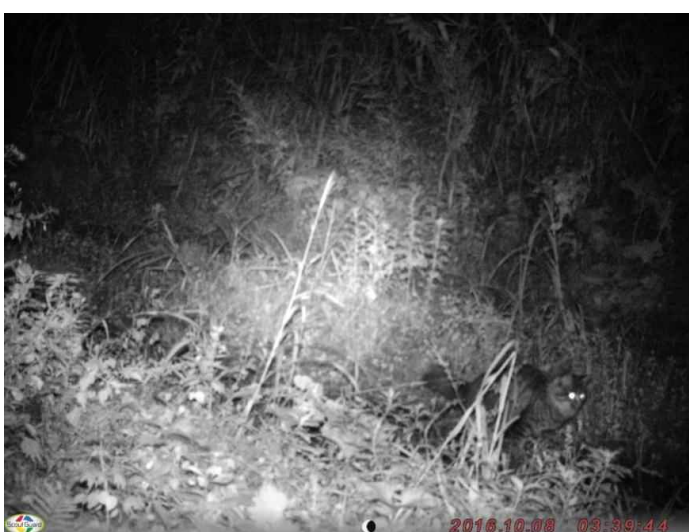
イエネコ (調査地4:平成28年10月8日撮影)