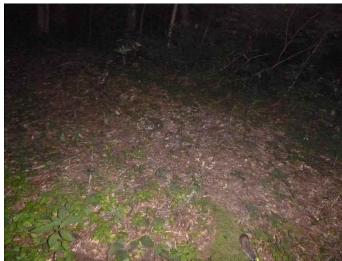
イタチ (調査地13:平成28年8月13日撮影)