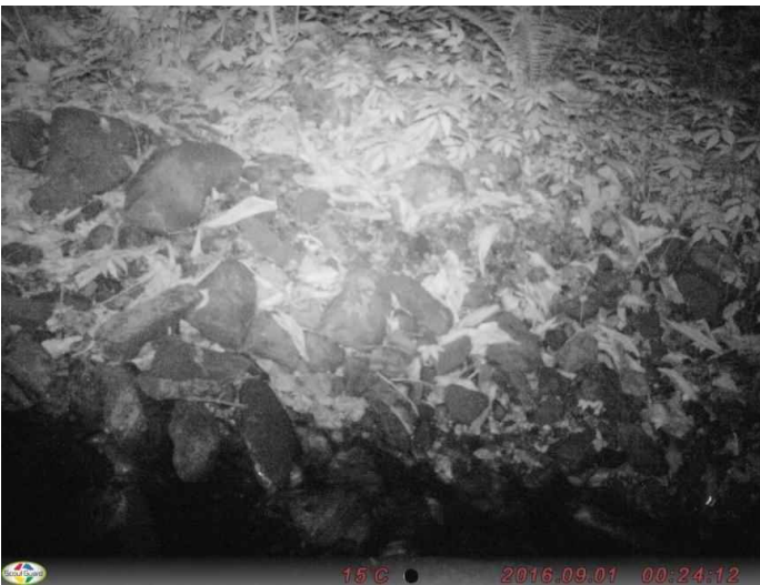
不明ネズミ類 (調査地20(右下):平成28年9月1日撮影)