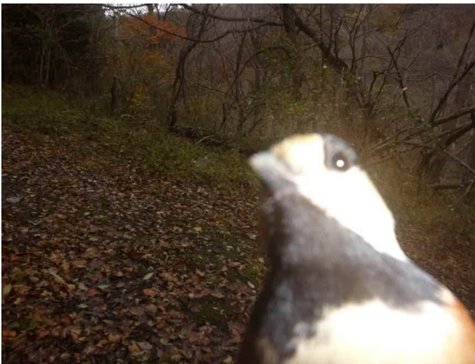
ヤマガラ (調査地8:平成28年11月11日撮影)