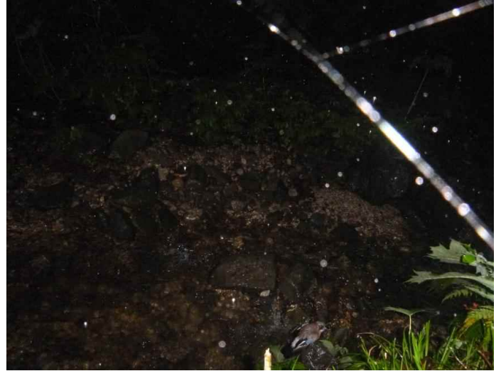
カケス (調査地20:平成28年6月25日撮影)