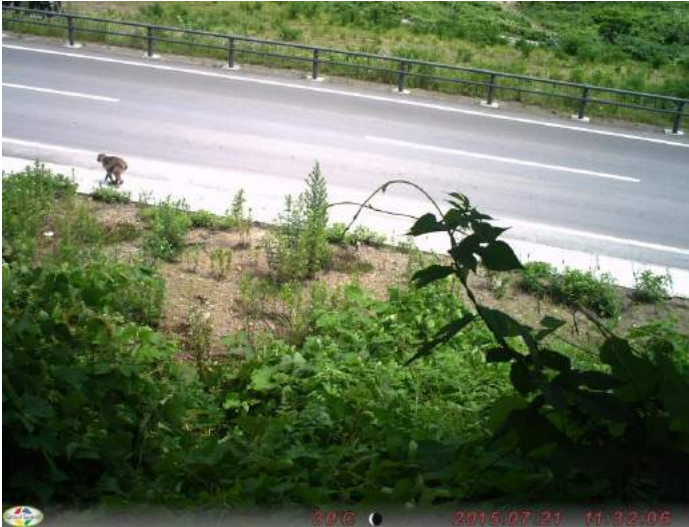
ニホンザル 撮影日:平成27年7月21日