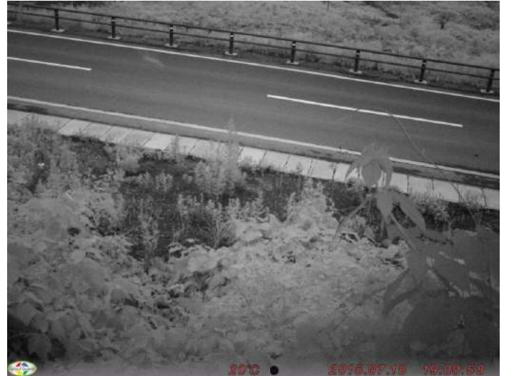
不明哺乳類 撮影日:平成27年7月18日