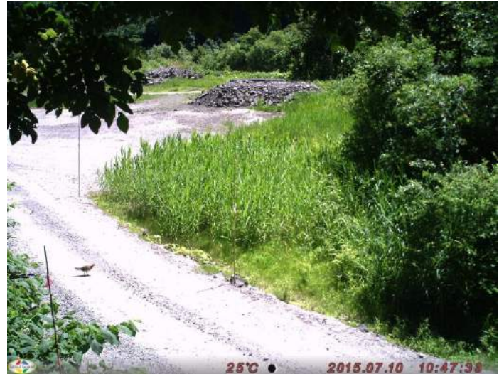
ヤマドリ 撮影日:平成27年7月10日