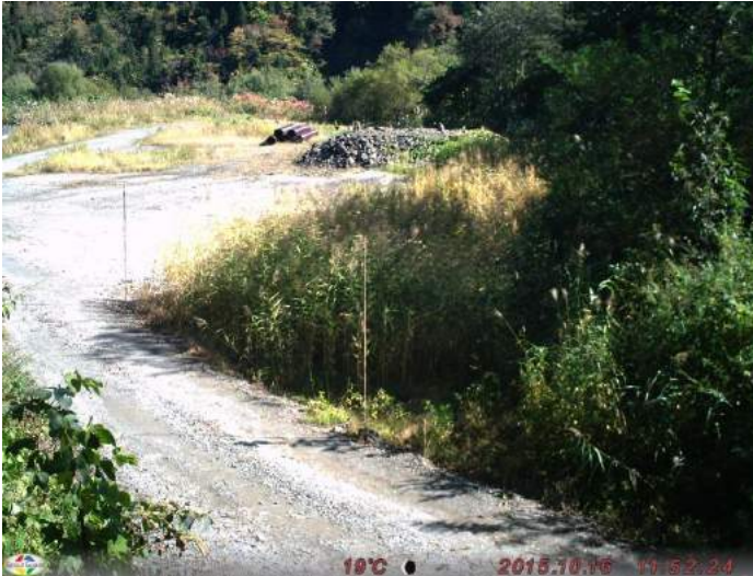
ニホンザル 撮影日:平成27年10月6日