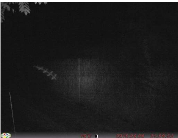
不明昆虫類 撮影日:平成27年6月8日