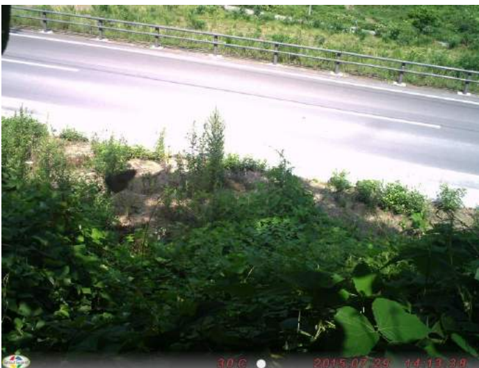
不明昆虫類 撮影日:平成27年7月29日