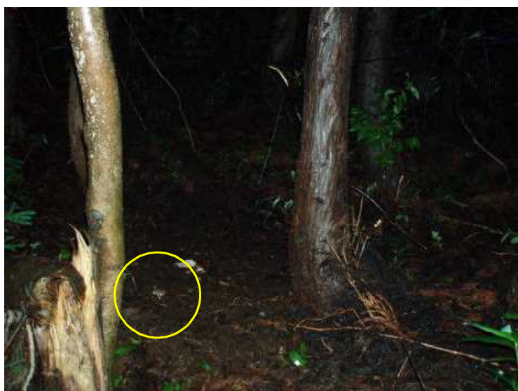
装置機種：フイルド・ノート DCs700 アカネズミ 平成21年7月28日 0:31 撮影