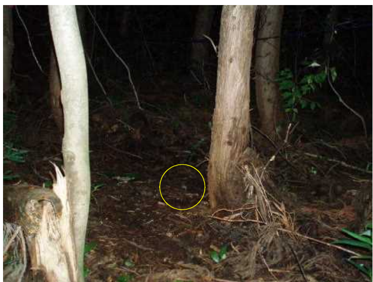
装置機種：フイルド・ノート DCs700 アカネズミ 平成21年8月2日 20:08撮影