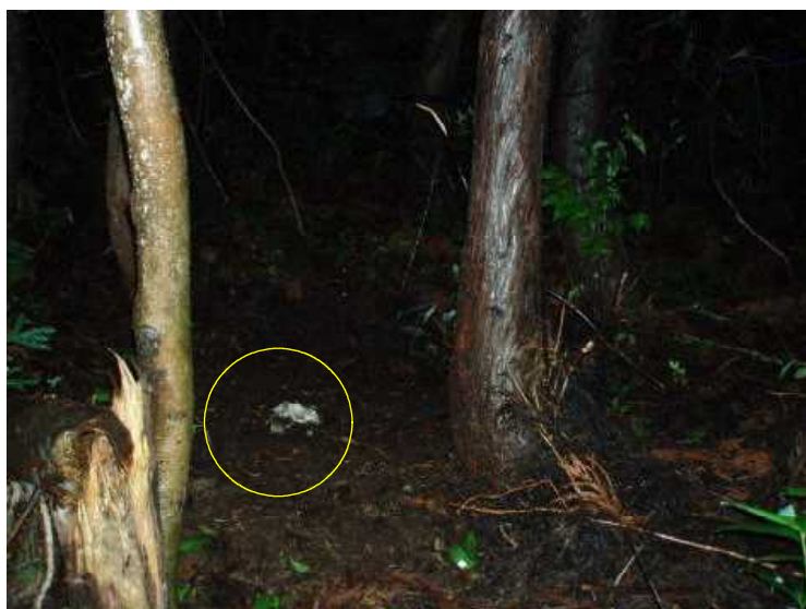
装置機種：ファイル・ノートDCs700 アカネズミ 平成21年7月27日 21：03撮影