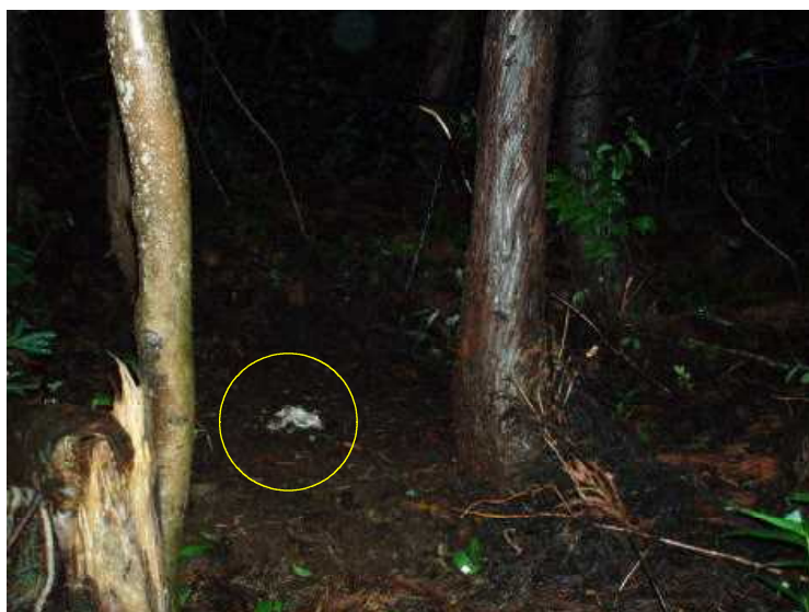
装置機種：ファイル・ノートDCs700 アカネズミ 平成21年7月27日 21：03：56撮影