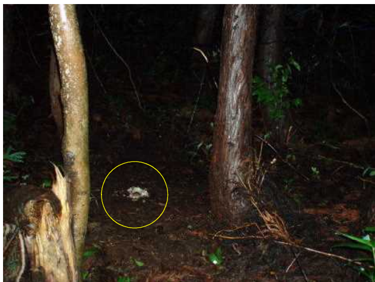
装置機種：ファイル・ノートDCs700 アカネズミ（ハ死°-食） 平成21年7月27日 20：43撮影