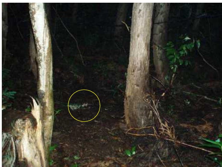
装置機種：フイルド・ノート DCs700 アカネズミ 平成21年8月2日 1:31撮影