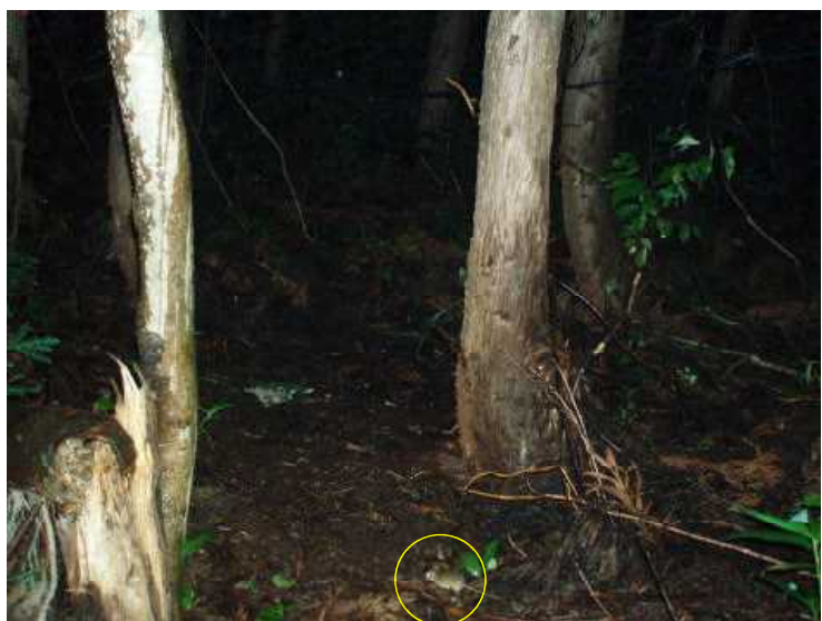
装置機種：フイルド・ノート DCs700 アカネズミ 平成21年8月2日 1:39撮影