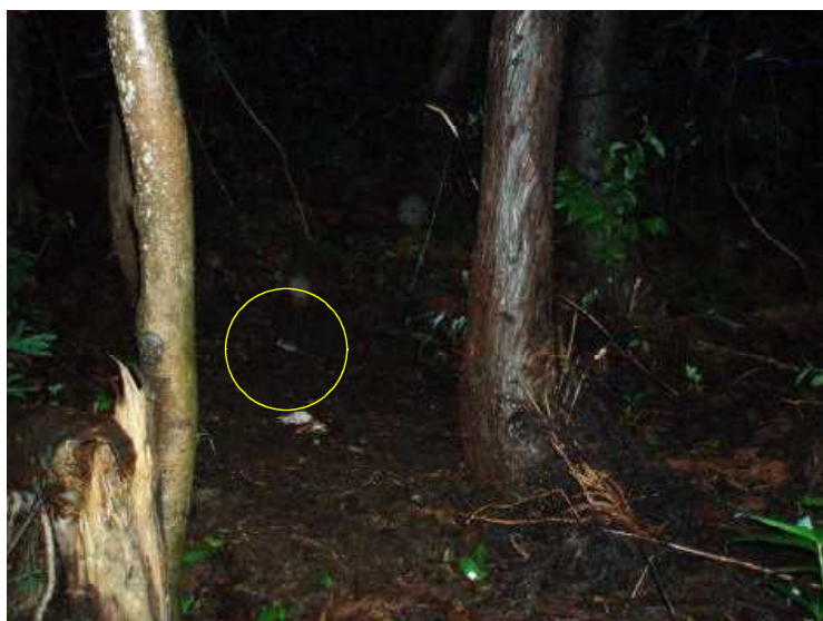
装置機種：フイルド・ノート DCs700 アカネズミ 平成21年7月27日 23:44 撮影