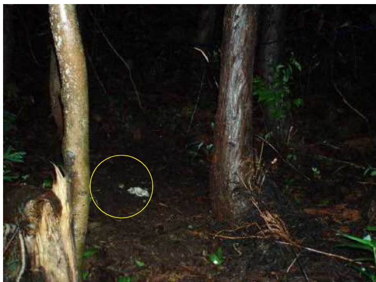
装置機種：フイルド・ノート DCs700 アカネズミ 平成21年7月27日 21:15 撮影