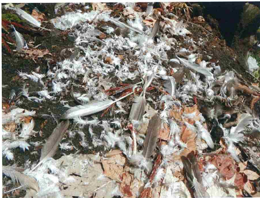
この写真は、カメラA地点の近くにあった鳥の羽と骨です。猛禽類かキツネの餌食になったものと思われます。残念ながら、カメラの撮影外でした。

また、その他の動物は撮影確認されなかったが、カメラ周辺の雪面において、種は不明であるが小動物の足跡が多数確認された。