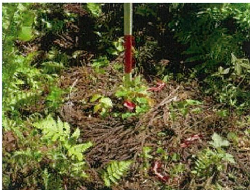
H29 年度実施箇所 (スギ枯葉多い)