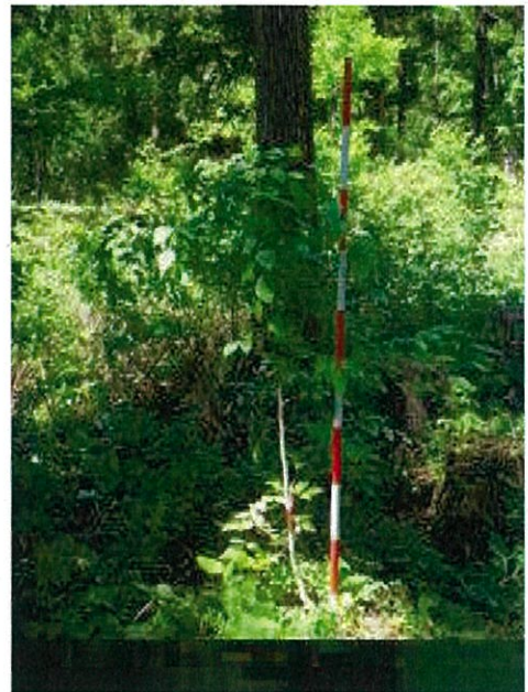
樹高1.75mのブナ (H 2 8 年度)