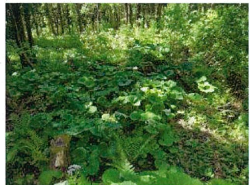
令和元年度実施箇所 (フキが下層を覆う)