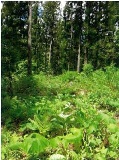
H 2 8 年度実施箇所