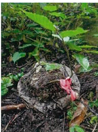
カミネツコン使用苗 (ブナ)