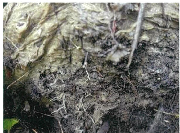
カミネツコンを突き破り根が土壌に入り込む