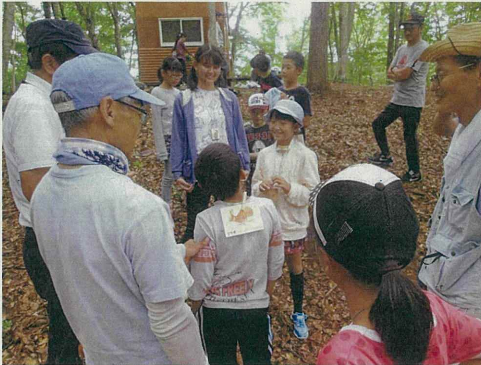
ネイチャーゲーム