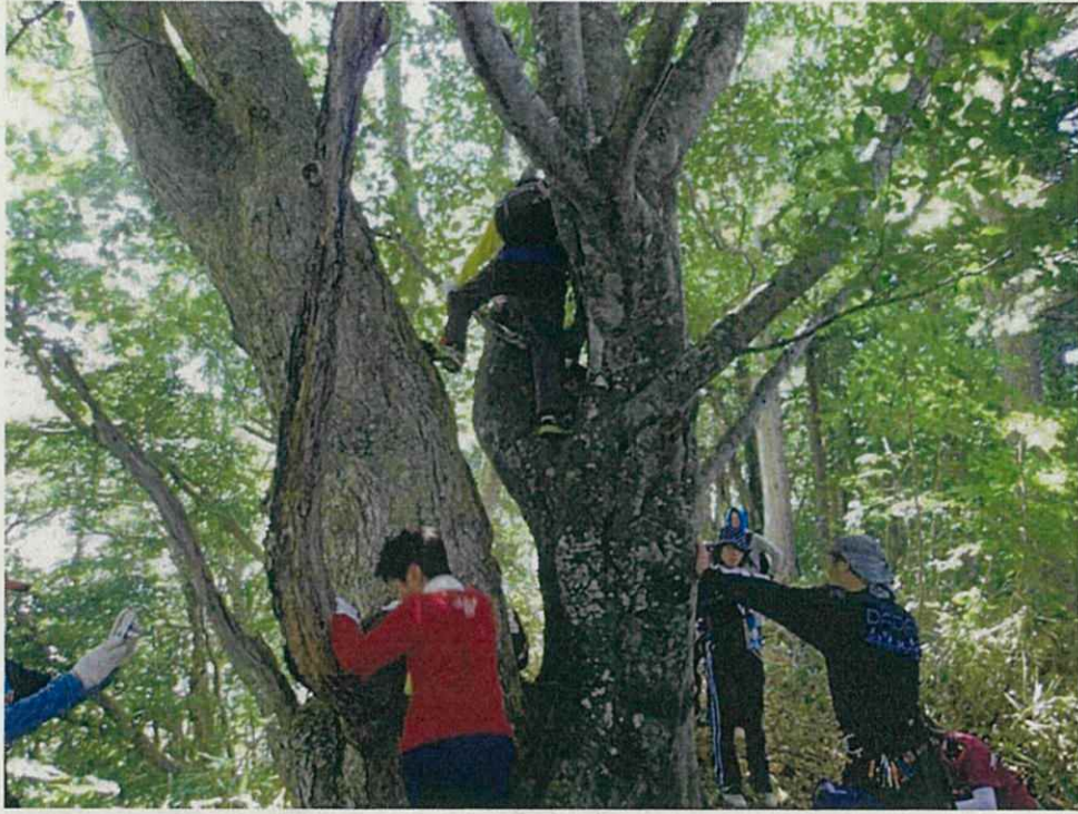
歩道上のブナとミズナラが合体した木へ登ってみました。