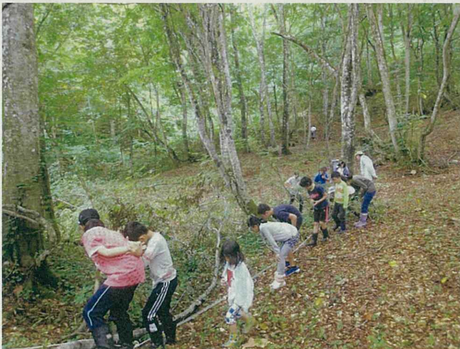
ネイチャーゲーム