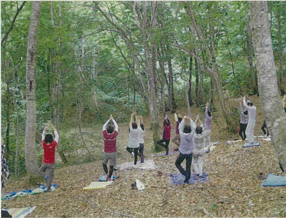
ヨガの講師を招いてヨガを体験