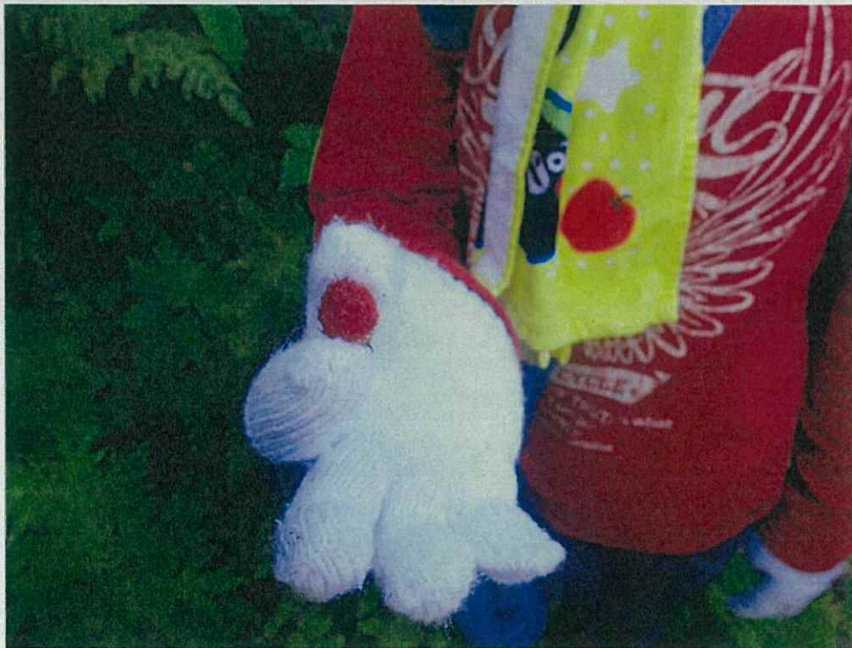
野イチゴを見つけて味わってみました。