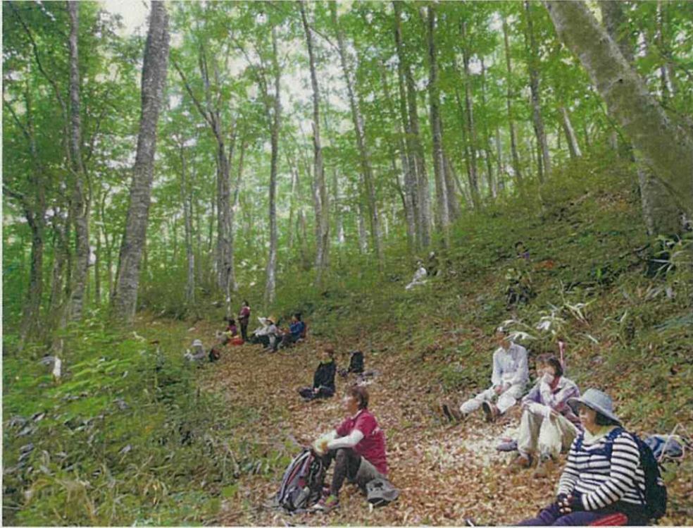
休憩時に瞑想しブナの森を体感