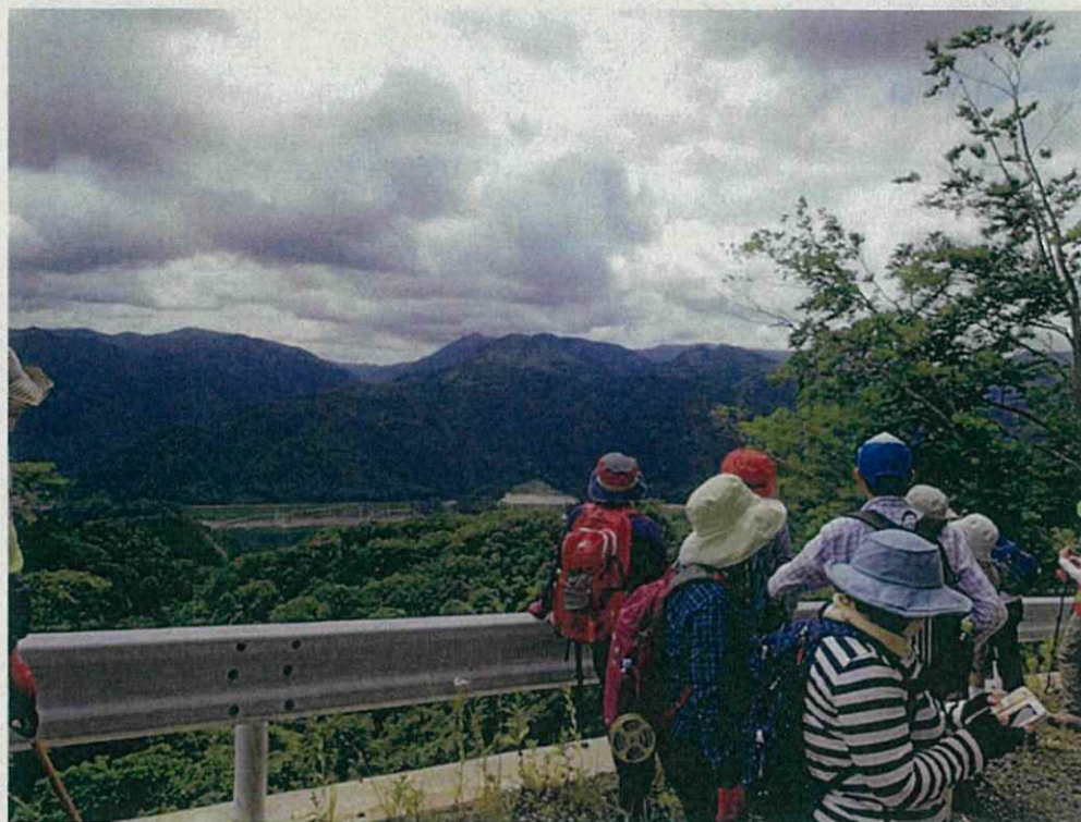
①津軽白神湖を望む