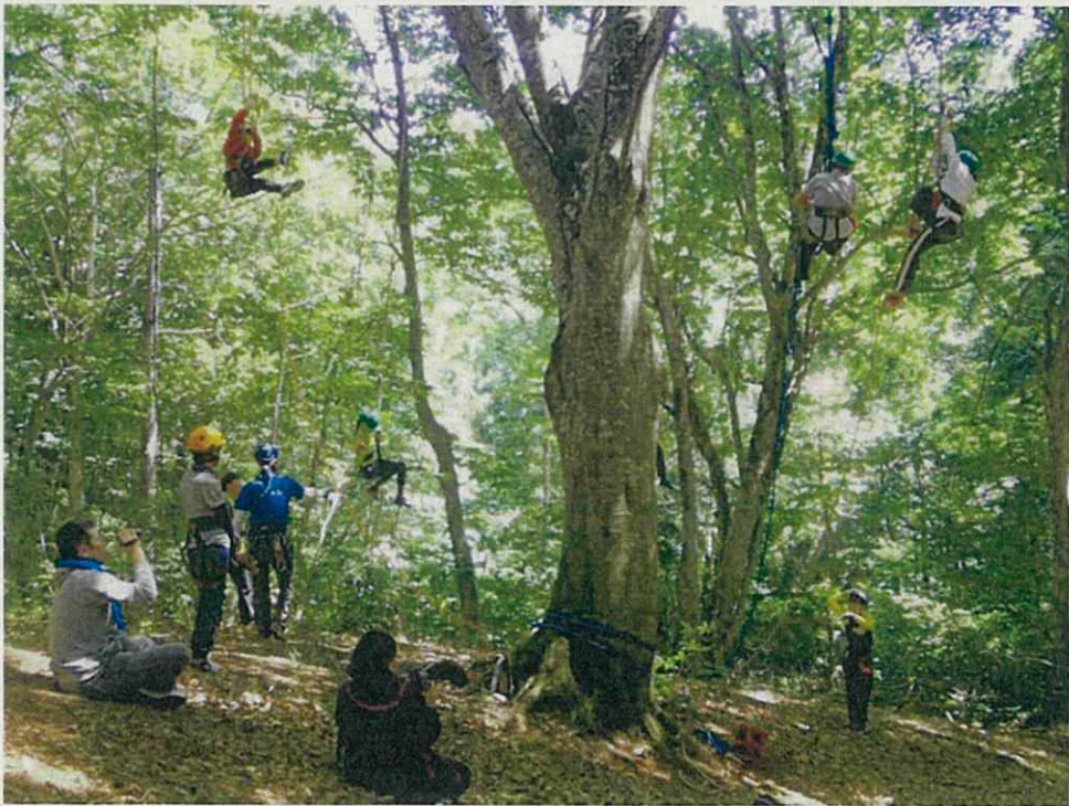
本日のメインイベント、ロープを使った現代版木登り体験です。