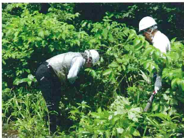
道路の法面、路肩などから広葉樹の稚樹を採取しました。