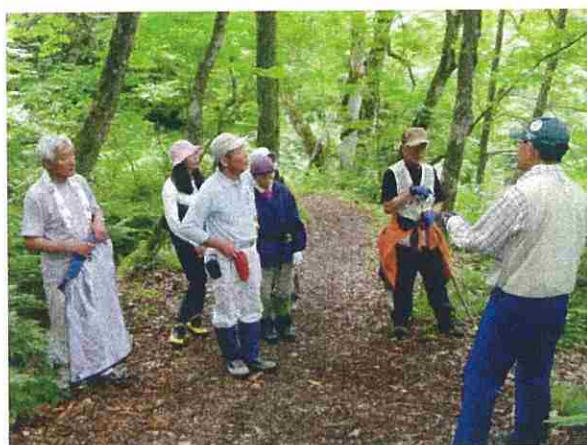
作業終了後、午後はくろくまの滝の散策を行いました。