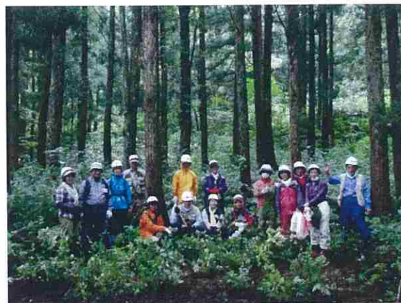
作業終了後、仮植した苗木の前で集合写真を撮りました。