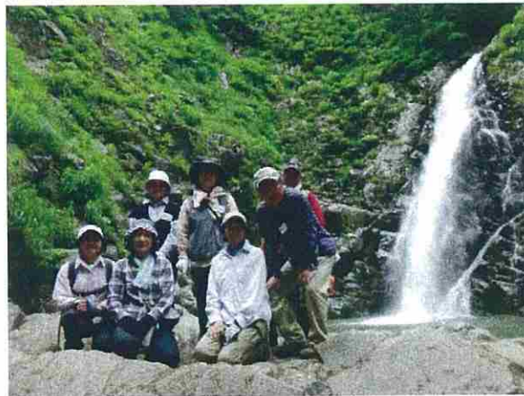
午後からは暗門第三の滝まで散策をしました。