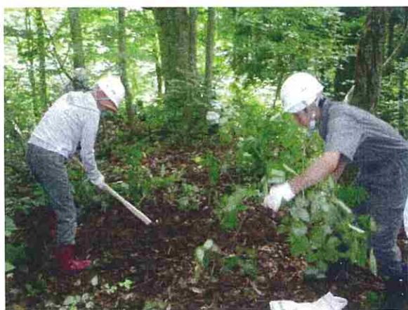
道路法面などから採取した稚樹を、林内に仮植しました。