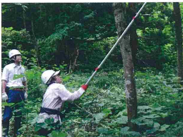
付近のスギ人工林で枝落とし作業も体験しました。