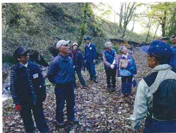
午後はくろくまの滝と赤石溪流線の散策を行いました。