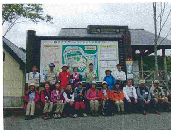
アクアグリーンビレッジAN MONでの集合写真です。