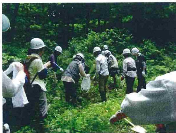
採取した稚樹は、付近の林内へ仮植しました。