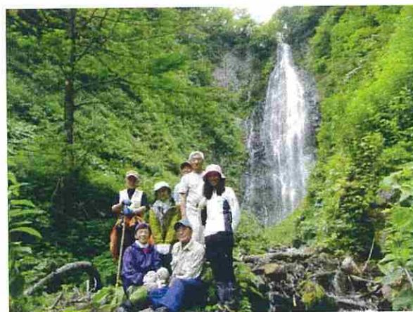
散策後、くろくまの滝の前で記念撮影を行いました。