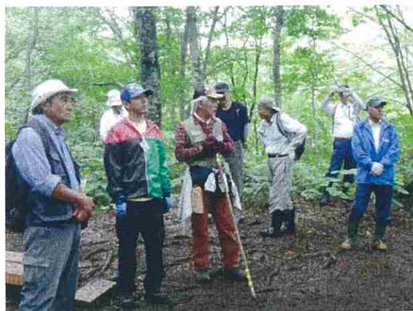
暗門の滝が不通のためブナ林散策道を散策しました。