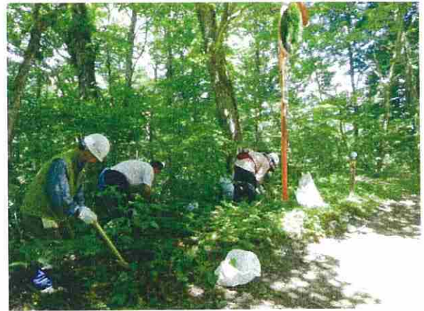
道路法面からブナ外広葉樹の稚樹を採取しました。