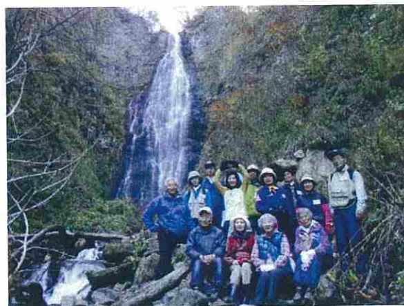
くろくまの滝の前で記念撮影を行いました。