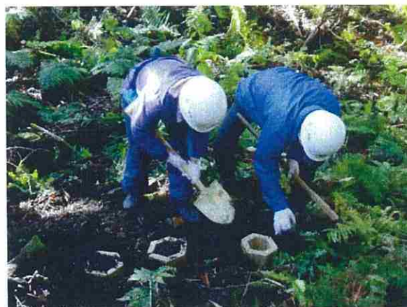
カミネッコンを埋めている様子です。