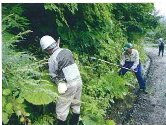
道路の法面、路肩などから広葉樹の稚樹を採取しました。