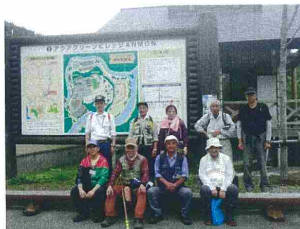
アクアグリーンビレッジANMONでの集合写真です。