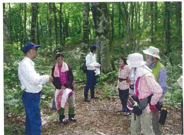
作業終了後、午後は遺伝資源保存林の散策を行いました。