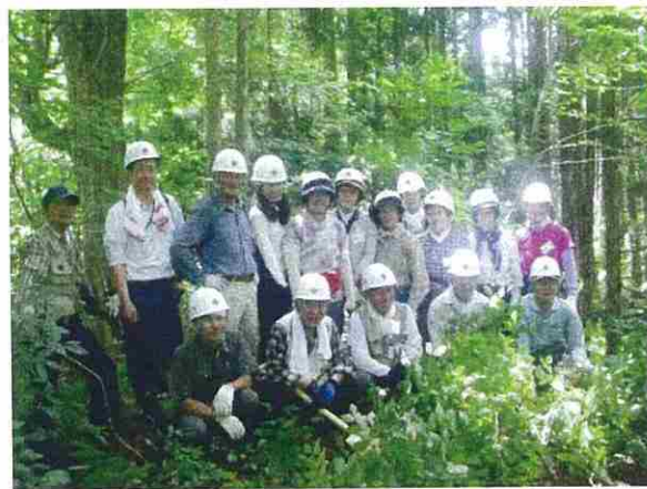
作業終了後、仮植した苗木の前で集合写真を撮りました。