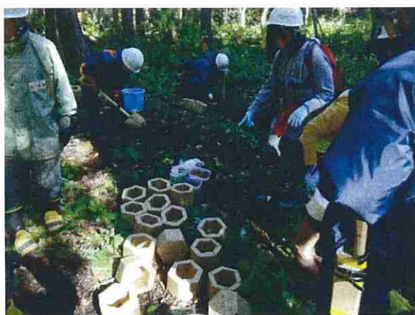
カミネッコンを使用して、広葉樹の種子を播種しました。