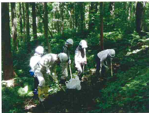
採取した苗木は、付近の林内に仮植しました。