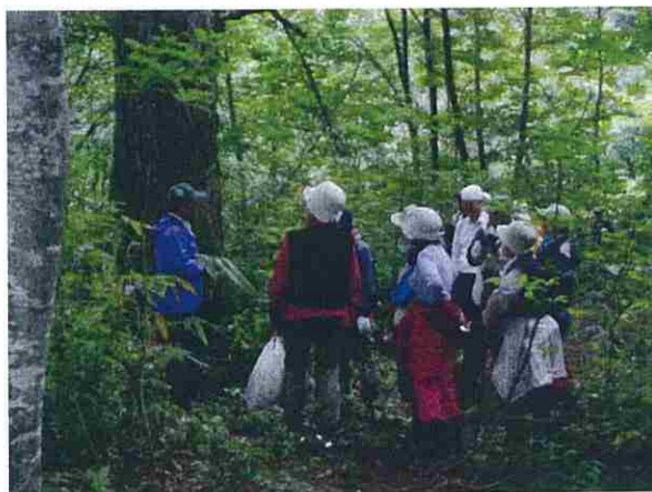
この日も暗門の滝が不通のためブナ林散策道の散策でした。