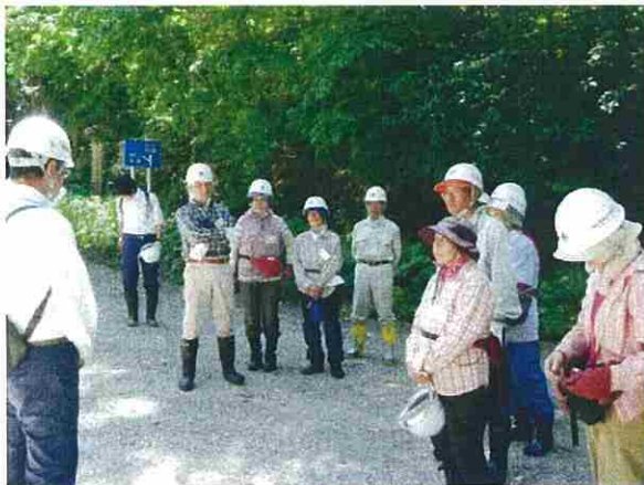
作業実施上の注意事項などを説明しました。