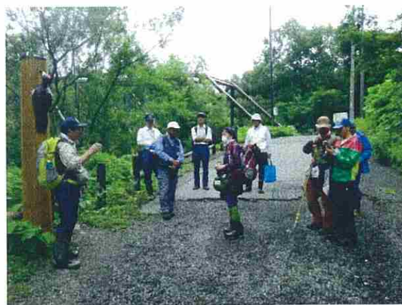
午後は天候も回復したので、散策を行いました。