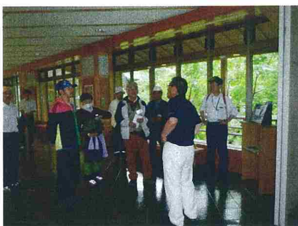
雨天のため、白神山地ビジターセンターを見学しました。