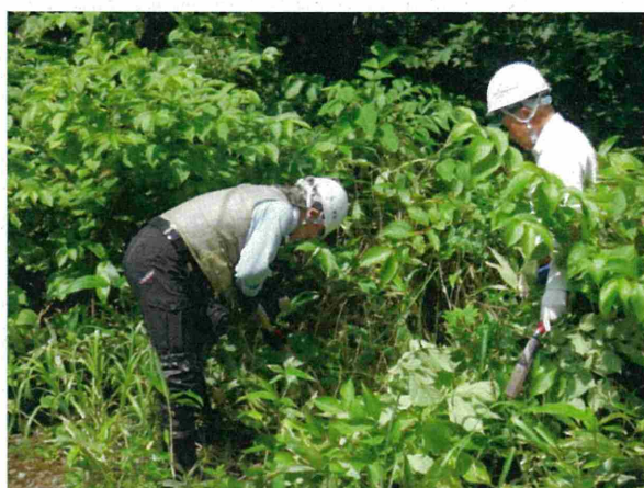
道路の法面、路肩などから広葉樹の稚樹を採取しました。