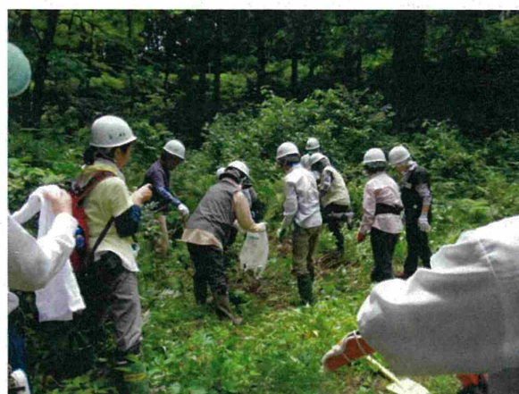
採取した稚樹は、付近の林内へ仮植しました。