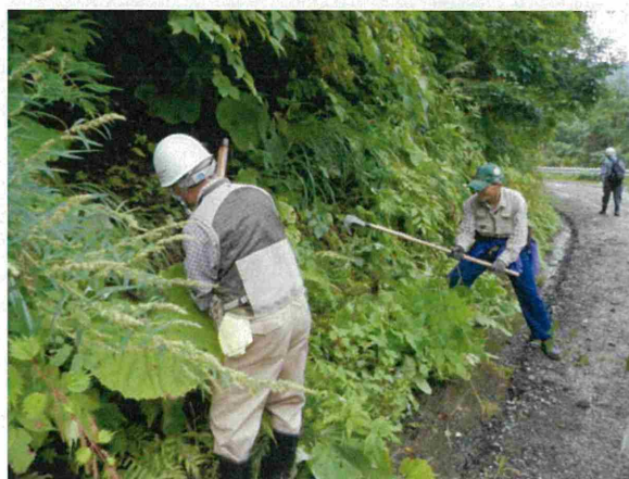
道路の法面、路肩などから広葉樹の稚樹を採取しました。