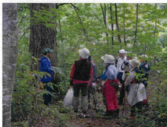
この日も暗門の滝が不通のためブナ林散策道の散策でした。