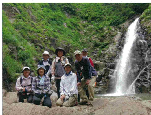
午後からは暗門第三の滝まで散策をしました。