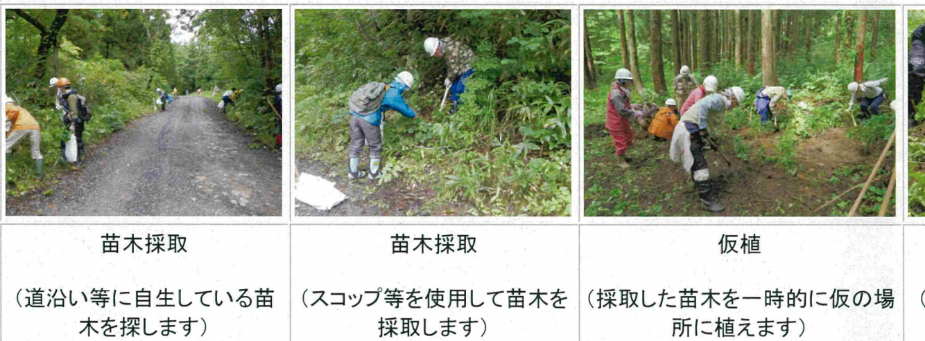
平成 27 年度「自然再生活動」の様子

自然再生活動 ～水を育む ブナ林再生教室～ New 【募集期間:平成 28 年 6 月 23 日(木曜日)から平成 28 年 7 月 8 日(金曜日)まで】