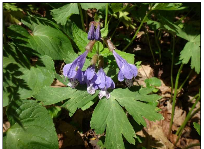
ラショウモンカズラ（シソ科）