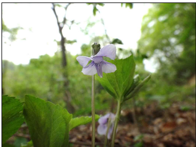
オオバクスミレ (スミレ科)

また、スミレ科は種類が多く、かつ似たものも多いので、いつも種の同定に迷います。今回のオオタチツボスミレとしているものについても、最後まで「オオ」を付けて良いか迷いました (汗)