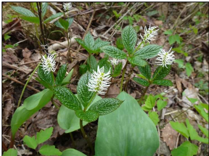
ヒトリシズカ (センリョウ科)

この中では少し地味目の花たちですが、林縁でそっと咲いているこういう花たちにも味があって好きです。