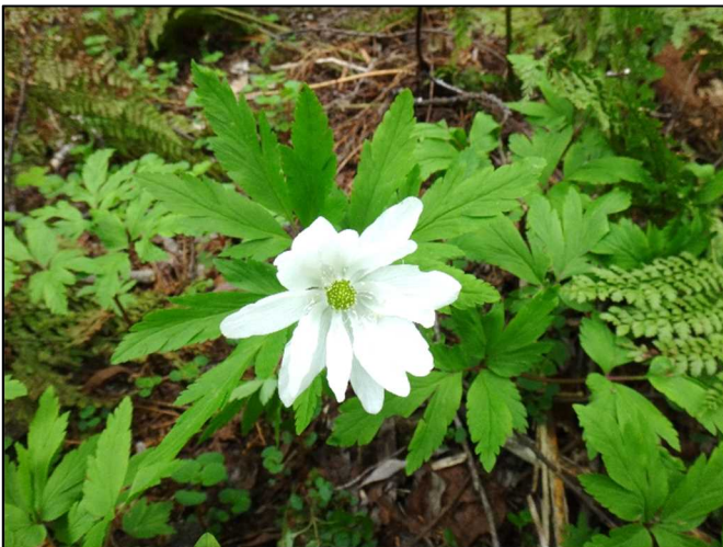
キクザキイチゲ（キンポウゲ科）

キクザキイチゲには白花と青花がありますが、写真のように、ここまで鮮やかな青花はあまり見かけたことが無かったので、見つけたときは嬉しくなりました。