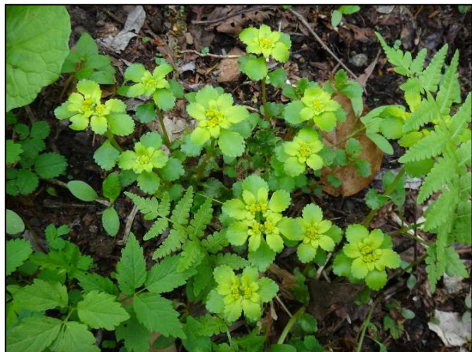
ネコノメソウ (ユキノシタ科)

また、スミレ科は種類が多く、かつ似たものも多いので、いつも種の同定に迷います。今回のオオタチツボスミレとしているものについても、最後まで「オオ」を付けて良いか迷いました (汗)