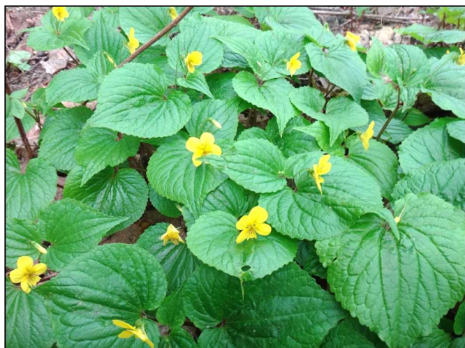
ナガハシスミレ (スミレ科)