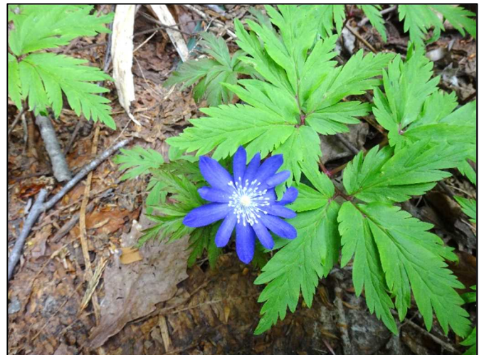
キクザキイチゲ（キンポウゲ科）

春の山の林縁では多くのユリ科の花が多く咲きます。ホウチャクソウもその一つですが、これは有毒で、食用になるアマドコロとよく似ているので注意が必要です。