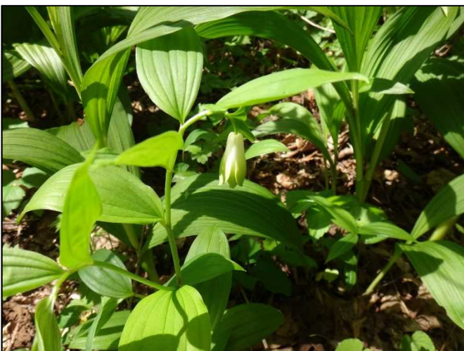
ホウチャクソウ（ユリ科）

春の山の林縁では多くのユリ科の花が多く咲きます。ホウチャクソウもその一つですが、これは有毒で、食用になるアマドコロとよく似ているので注意が必要です。