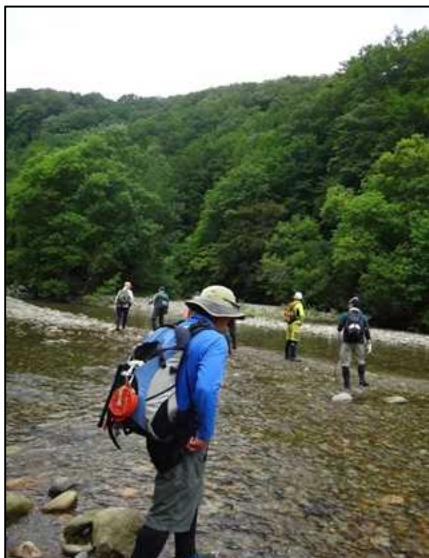
大川本流遡上しパトロール開始

今回の巡視では、以前使用されていた野営場を確認しましたが、最近の使用形跡もないことから現時点では利用されていないことが確認されました。