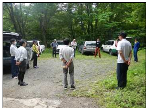
赤石川パトロール後の講評

次は、4コース目となる太夫峰コースです。白神ラインから世界遺産地域へと至るルートで、参加者5名により巡視活動を実施しました。