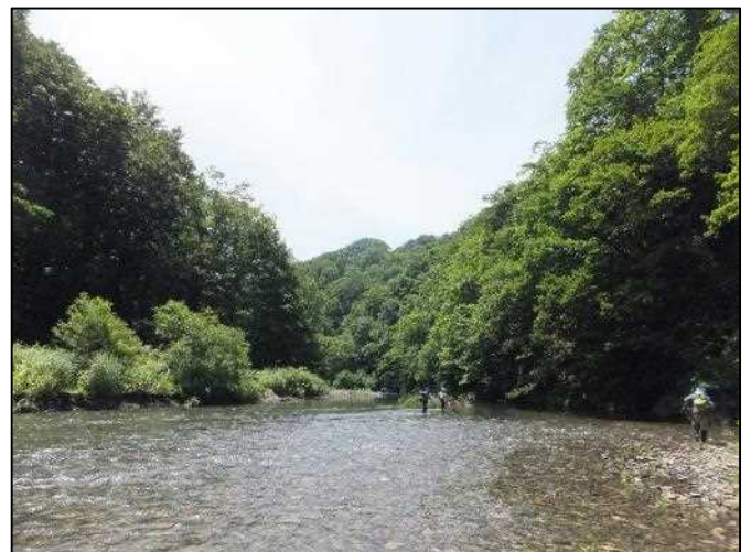
晴天下の赤石川の景色

7月10日に、世界遺産地域のパトロールの一環で赤石川に行って参りました。個人としては初めての沢登りだったので不安だったのですが、天候に恵まれ、心強い先輩の方々との臨んだことで、ケガなく無事にパトロールすることができました。パトロールの結果、焚火や釣り等のマナー違反にあたる痕跡がなく、良好な状態が保たれていることが確認できました。しかし、道中は崖や川の深いところが点在しているので、慎重に行動する必要がありました。私は、スパイク付きの沢登り用の靴を履いて臨み、先輩の方々からの丁寧なアドバイスのおかげで崖や川を歩行することができました。なので、入山する際には装備を整えたり、情報を入手したりして万全の体制で臨むようお願い致します。(木村)