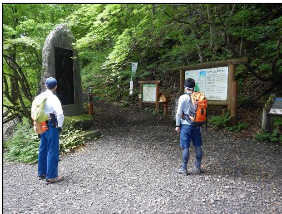
大峰岳登山口（青池付近）、巡視コースを全員で確認