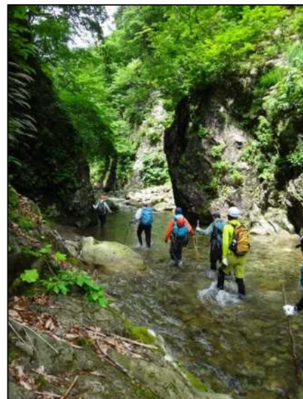
周囲を確認しながら、ひたすら川を遡行中

次は、2コース目となるブナ林散策道コースです。こちらでは白神山地森林整備協力金受付所前広場にて、参加者3名により世界遺産を訪れる入山者にパンフレット配布を行いマナー向上への協力を呼びかけしました。この日はコロナ禍でもあり、夏休み前の平日ということもあってか、例年に比べ入山者も少なく午前中の段階で14名