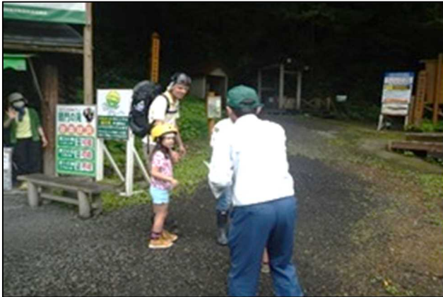
パンフレットの説明後、入山者への声掛け活動

の者がブナ林散策道や暗門溪谷へと入山しました。時期的に涼を求めるなら暗門溪谷ルートに向かい暗門の滝で涼むのがお勧めかと思います。