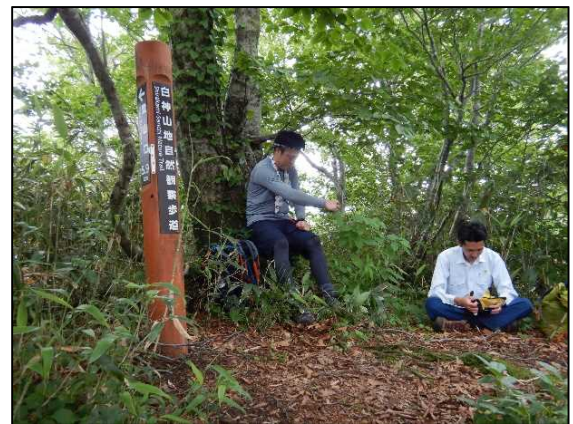
大峰岳山頂で。この後豪雨となる

以上で、今回のパトロールの内容を粗々ながらご紹介したところですが、遺産地域内でのマナー違反等については、今回の巡視活動中には、確認されなかったところですが。