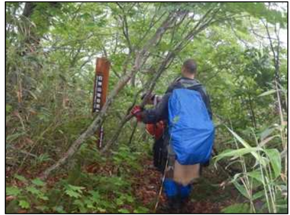
太夫峰からの帰路雨天となる

最後の5コース目は、白神岳登山口及び大峰岳コースです。今回のパトロールのコース中、最も過酷な状況であった様です。