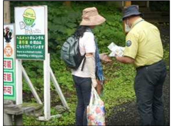
入山者へのパンフレットの説明

次は、3コース目となる赤石川コースです。赤石川堰堤から赤石川を遡上し世界遺産地域緩衝地域を経て核心地域を巡視するコースで、参加者11名により巡視活動が実施しました。