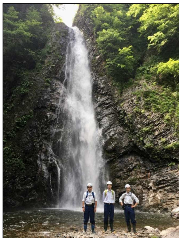
暗門第2の滝の前で