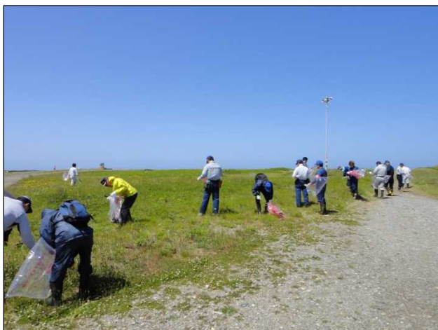
作業開始直後の様子

開会式後、参加者一斉に作業区域になだれ込む。冒頭申し忘れていましたが、この作業区域は周辺に防風保安林が設けられているだけあって、安定して風が強い。油断していると拾ったゴミやごみ袋まで吹っ飛ばされる始末。加えてメガネユーザーには、潮風のためメガネに潮が付着し、時間とともに視界不良となるハンデあり。序盤こそ苦戦する光景が見られたものの、徐々に作業環境に適応し、参加者全員黙々とゴミ回収に取り組んでいました。