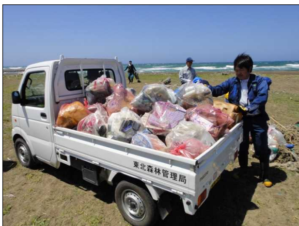
回収したゴミを軽トラでピストン輸送

毎年のことながら、漂着ゴミはやむを得ないとして、せめて現地におけるゴミの投棄が無くなってくればと感じた次第です。