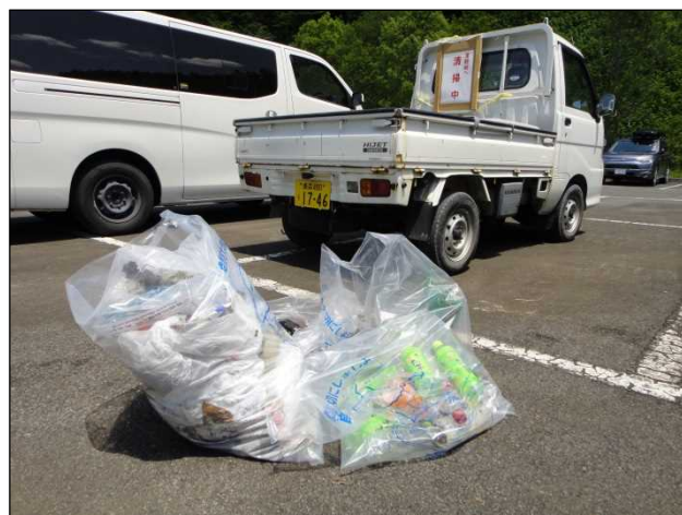
今回、回収されたゴミ