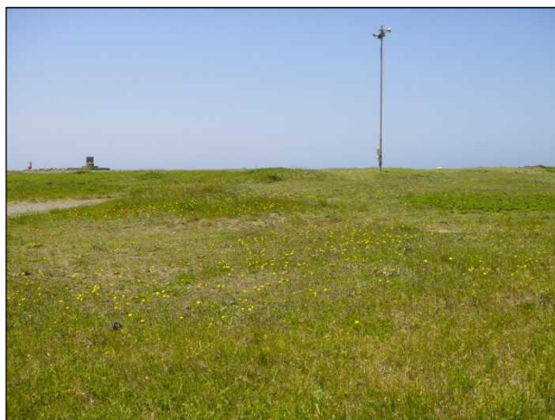
作業終了後の光景（きれいになりました）