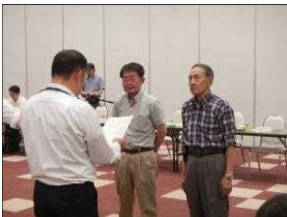
委嘱状交付式的一幕