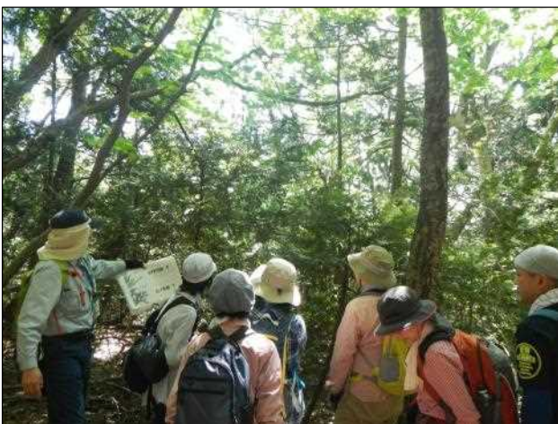
所長お手製の説明メモで解説中

王池での昼食後、午後は午前中の広葉樹林とは全く違うヒバ林を散策し、青森県の県木であるヒバの特性等の説明を行い、午後のコースのメインである日本キャニオン展望台では、迫力ある雄大な岩肌皆さん感銘の声をあげていました。