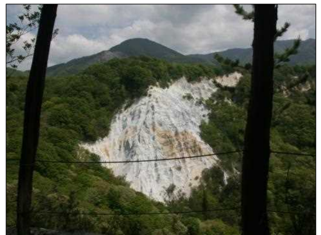
日本キャニオン展望所からの遠望

今回のコースは、今まで散策したことのないコースでしたので、リピート参加者からも「とても楽しかった」との声が聞かれ、怪我も無くスケジュールも順調に令和初の森林教室を無事終了しました。（小倉）