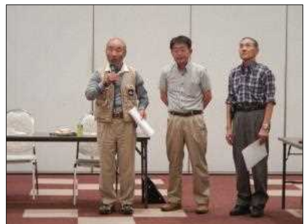
巡視活動に懸ける意気込みを一言