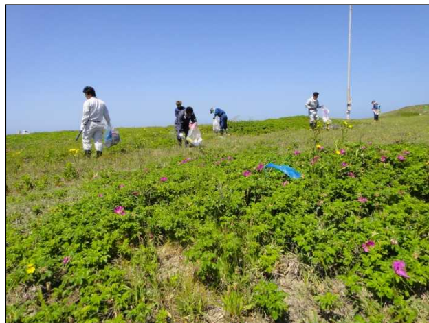
黙々とゴミ回収に勤しむ

ゴミの内訳としては、ロープの類が一番多い様で、探すまでもなく次々回収でき、続いて空き缶やペットボトルの類（国際色豊か）。今年の大物として、車のタイヤが回収されました（こんな所まで捨てに来なくても・・・）。