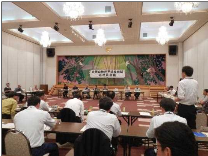
巡視員会議の様子

また、冬季閉鎖で閉ざされていた白神ラインも5月30日に開通し、入山を待ち望んでいた多くの人達が白神山地を訪れると思います。この地を訪れた際、巡視活動中の巡視員の方と出会う機会があると思いますが、その時は、巡視員のマナー向上のための啓発活動をご理解ご協力のうえ入山マナーを守り、白神山地の豊かな自然を堪能していただければと願っております。(三浦)