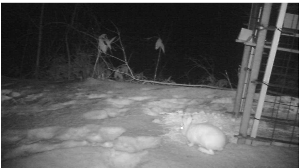
写真3 ニホンノウサギ (2019.01.12 深浦町吾妻川)

3点目（写真3）はニホンノウサギです。小型囲いわな付近に撒いた古い牧草を食べているようです。耳先の黒い毛以外白くなる冬毛で、ウサギのチャーミングポイントである耳と後ろ足が確認できます。