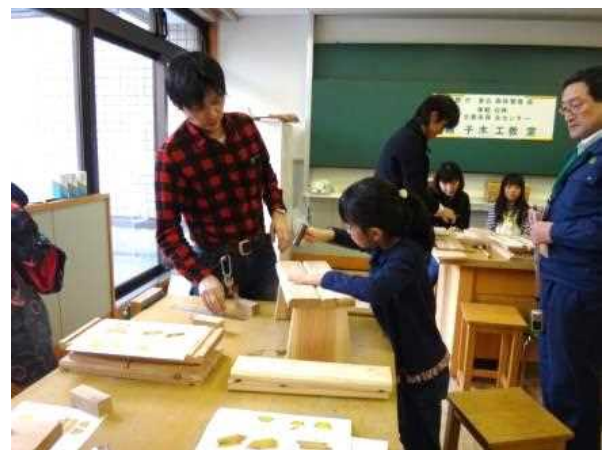
親子木工教室の様子

平成31年2月23日（土）、24日（日）の両日、「白神山地ビジターセンターがやって来た in 青森市&Kids フェア 2019」が青森市にある県総合社会教育センターで開催されました。このイベントは、世界自然遺産白神山地の価値及び白神山地ビジターセンターを広く県民に周知させ、施設の利用拡大を図るとともに、自然環境への関心と理解を深めてもらうため、白神山地周辺の関係団体とともに開催しており、当センターでは地域振興の活性化につながる木材利用を促すため、親子木工教室を行いました。抽選により2日間で概ね80組の親子が青森県産材のスギを使用したイス&フラワーボックスの製作に取り組み、親も子も熱中しながら森を感じる製品を作成していました。