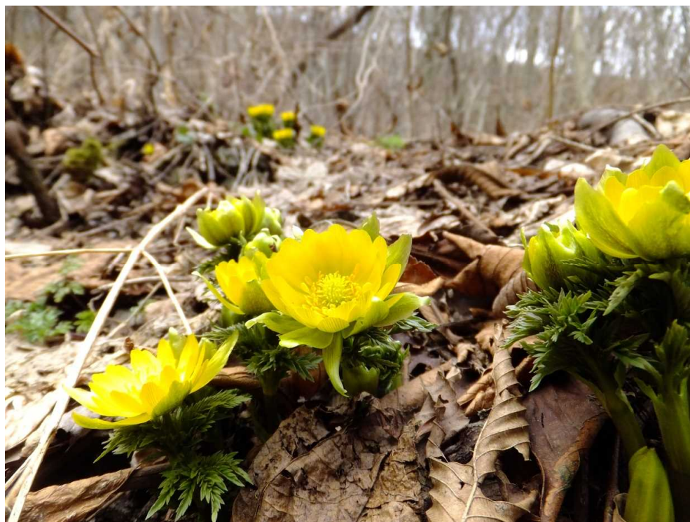
フクジュソウ【福寿草】

「早春に黄金色の花を咲かせることから、一番に春を告げる草……。」と、和名の由来はありますが、とにもかくにも縁起の良い漢字が2つも付けら