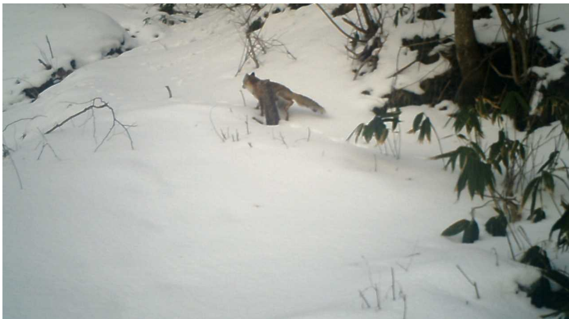
写真 1 キツネ（2019. 02. 17 深浦町吾妻川）

最初の写真は（写真 1）はキツネです。切り株に左後足をあげて用を足す姿が確認できます。私はこの画像を見て、やっぱりキツネはイヌ科なんだと再認識しました。