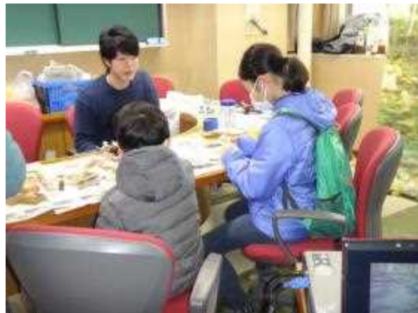
チーム「やまぼんず」ブースの様子