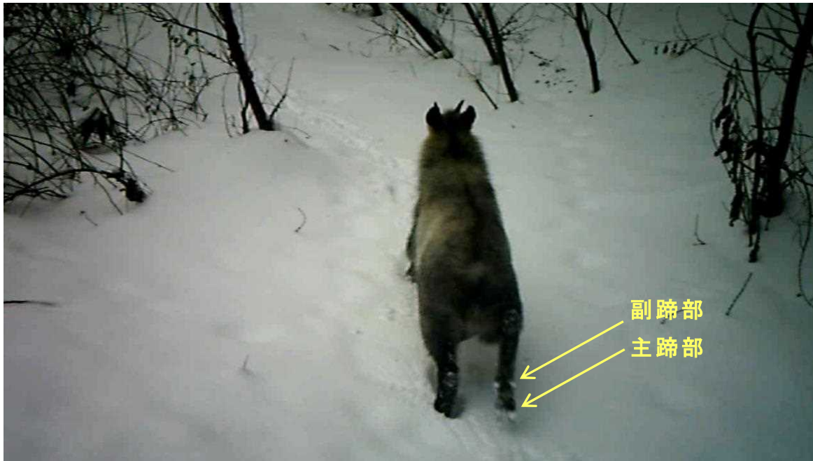
写真2 カモシカ (2019.01.04 深浦町吾妻川)

2点目（写真2）はカモシカです。このカモシカは、数分前に別のカモシカが歩いた跡を同じように歩いていました。この画像を確認して、足跡だけで頭数を判断することは危ないと思いました。あと、「白神の絆 No.151」の中で写真を使って「カモシカと思われる足跡」の説明をしてる部分がありまして、その中の『主蹄部・副蹄部』が画像から確認できます。