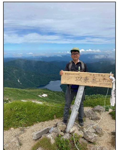
前任地の合同パトロールにて

これから白神山地のフィールドを歩き、地域の関係者の皆さんと触れあわせていただきながら、豊かな白神山地生態系の保全管理の一端を担っていく所存ですので、どうぞよろしく願いいたします。