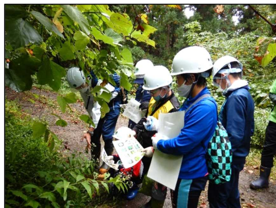
職員が植物の説明をしている様子