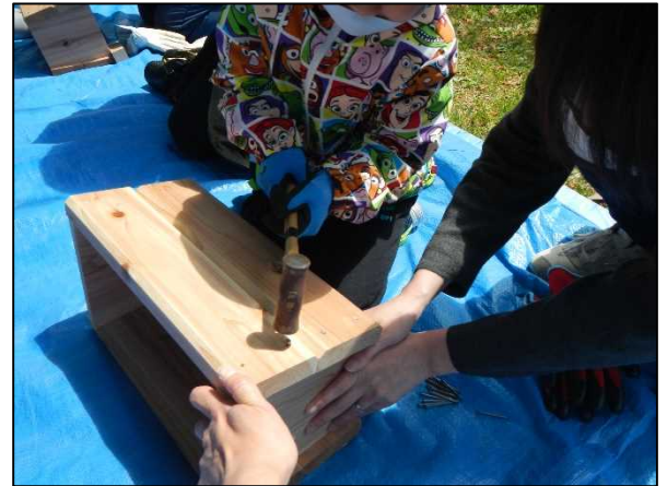
木製プランター作り

5月12日（水）、鰺ヶ沢こども園にて園児9名による木製プランター作成および花植え活動を津軽森林管理署5名、津軽白神森林生態系保全センター4名で実施しました。この行事は、平成22年度から継続して実施していましたが、昨年度は新型コロナウイルス感染防止のため中止となっていました。今年度は、園児のみなさんに木とのふれあいを体感してもらうため、行事内容に新たに木製プランター作成を追加し実施しました。