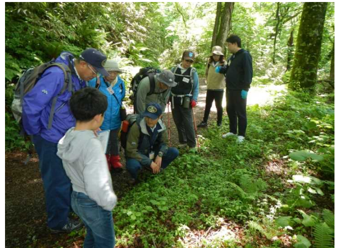
説明に聞き入る参加者の皆さん

当センターでは10月14日に西目屋村方面で第二回目の森林教室を、自然再生活動を7月22日と9月16日に行う予定です。多くの皆様の参加をお待ちしています。(吉川)