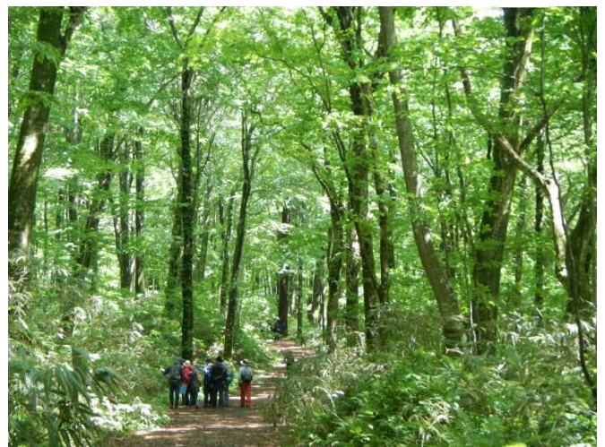
ブナ自然林を見学する参加者