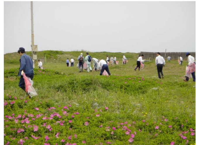
ゴミ袋を手にゴミを回収中