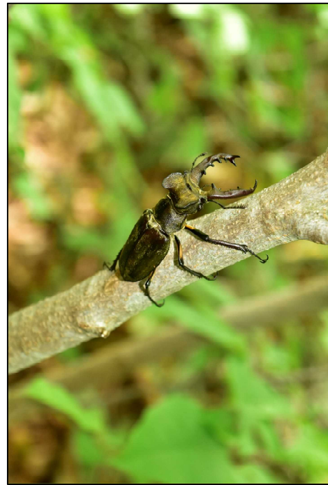
黄金色に輝くミヤマクワガタ