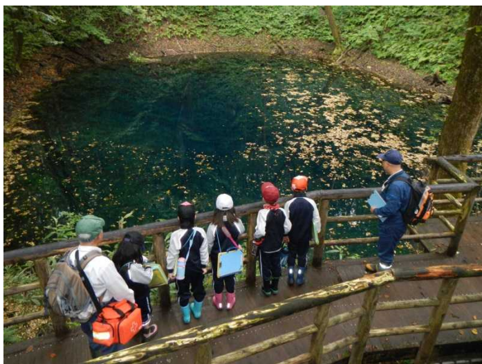
湖沼郡の散策をしました。