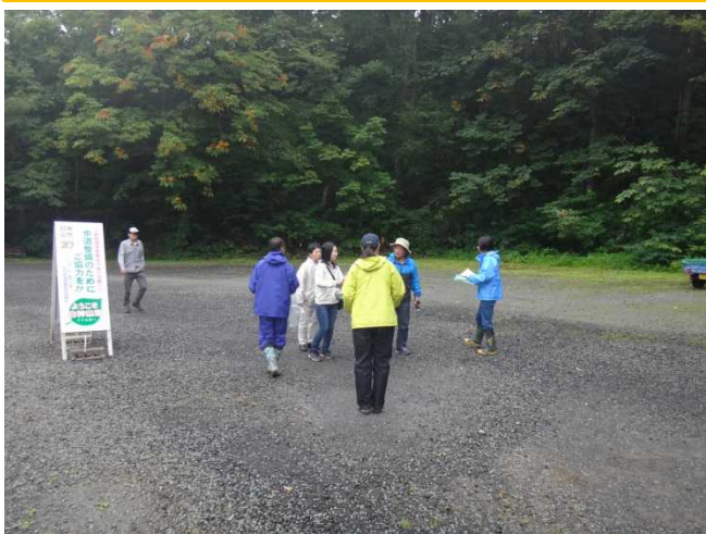
入山者へチラシを配布する参加者

9月9日(水)今年度第2回目の白神山地世界遺産地域合同パトロールを実施しました。