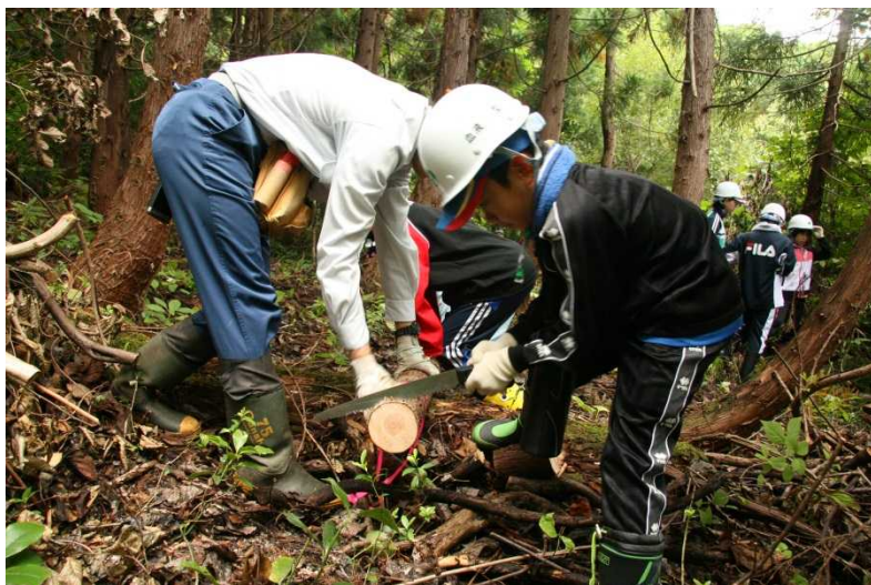
伐倒した木を使ってコースター作り