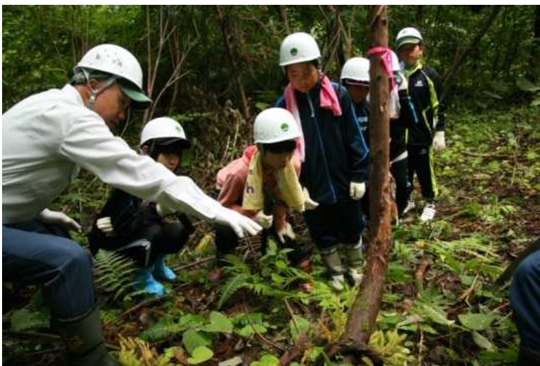
説明を受ける姿は真剣そのものです

3日は西海小学校5年生18人が、4日は舞戸小学校4年生37人が同町矢倉山国有林でスギ人工林の間伐体験を行いました。職員の指導に真剣に聞き入り、作業を開始すると次々と形の悪い木や細い木を伐倒していきました。