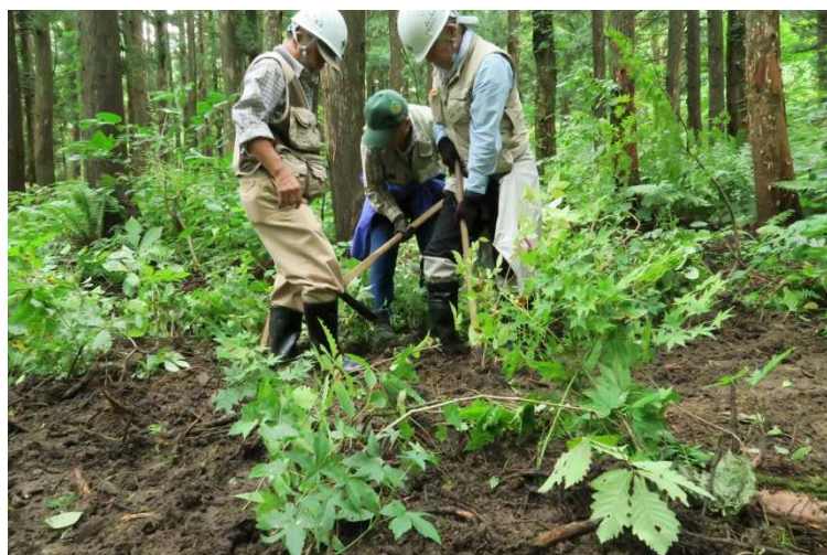
今回もたくさんの苗木を採取していただきました!!