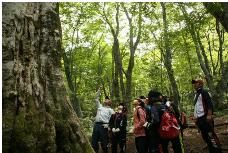
気持ちの良い天然林のなかを散策しました。