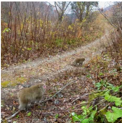
モフモフなニホンザル

紅葉も色あせ始めた 11 月 5 日（木）、釣瓶落峠に向かう県道沿いに今年合計 28 台目となるセンサーカメラを追加設置しました。2 週間後に回収したところ、モフモフの冬毛をまとったニホンザルが写っていました。いかにも暖かそうで、冬を越す準備万端！といったところでしょうか。