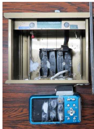
クモの巣が付着した センサーカメラ

私達もカメラが積雪で壊れないように撤去し始め、11月24日、海沿いの3台を回収して半年に渡るモニタリング調査を終了しました。ニホンジカは、先月お伝えした4箇所以外ではその後撮影されませんでした。