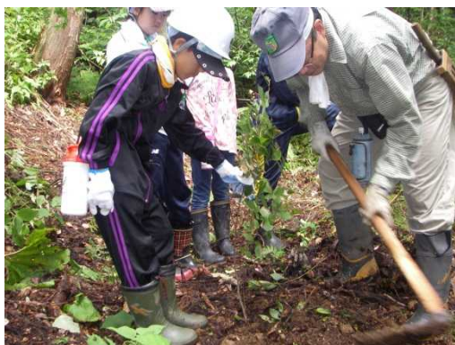
ブナの幼樹を植え付け

(例1) で仮植えした苗木を広葉樹が生育していない箇所に植え付けます。その後は下草刈りを行ったり生育調査などの観察をしながら、必要最小限の手助けを継続して元の植生に近い森林へ誘導していきます。