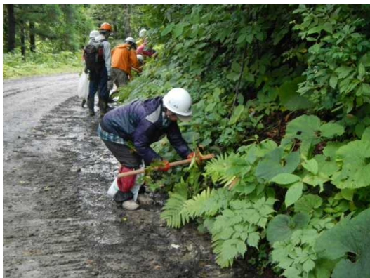
刈り取られる前に苗木を採取

白神山地には県道岩崎西目屋弘前線（通称：白神ライン）が通っています。車道沿いの木は大きくなると安全通行の支障となり刈り取られてしまうため、刈り取られる前に苗木を採取し、仮植えをして備蓄しています。