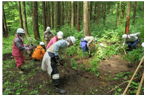
採取した苗木は植樹が必要な場合に備えて仮植えします。