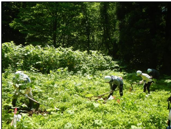
第1回自然再生活動の様子