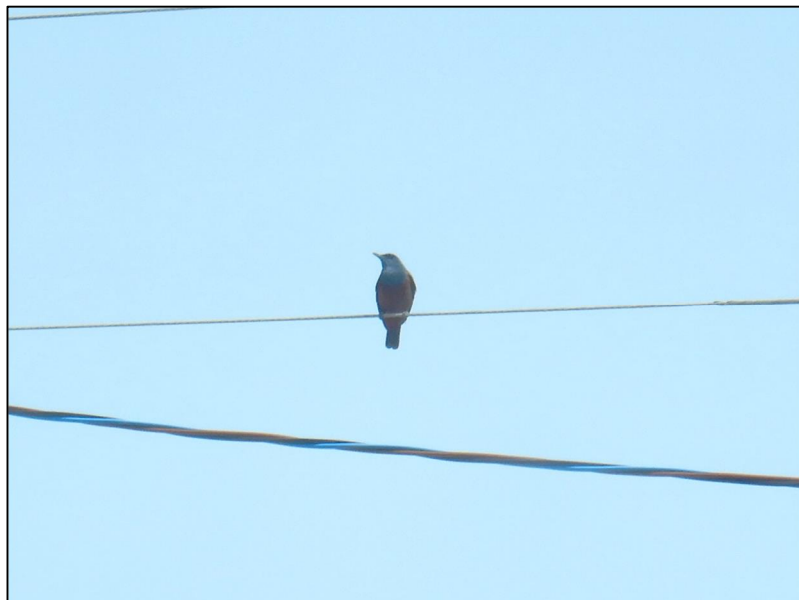
イソヒヨドリ（オス） （令和8年4月20日撮影）