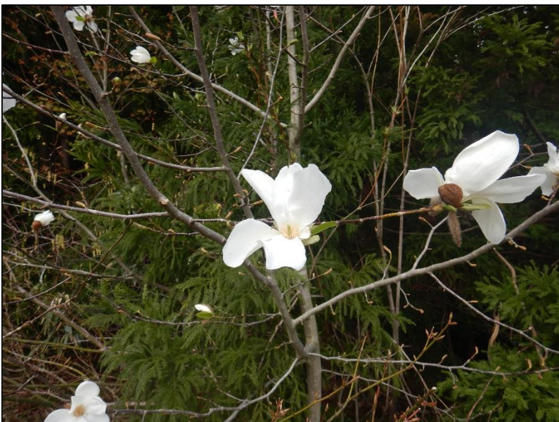
コブシ (令和8年4月24日撮影)