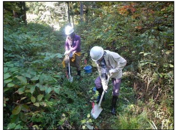
第2回自然再生活動の様子

各募集期間につきましては、概ね開催日の1ヶ月前を予定しております。 詳細につきましては、5月号と8月号の白神の絆にてお知らせいたします。