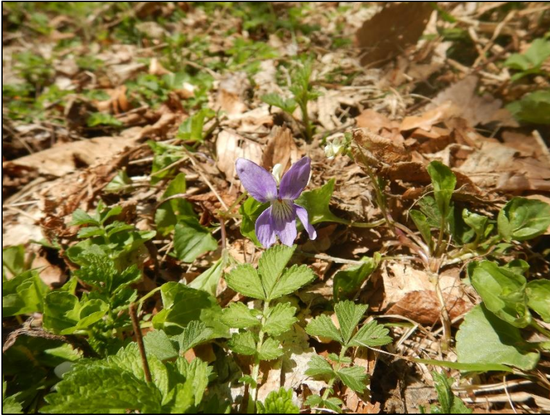
タチツボスミレ (令和8年4月24日撮影)