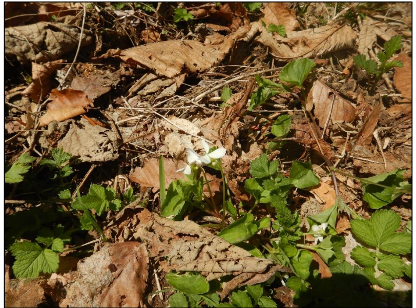
シロバナタチツボスミレ (令和8年4月24日撮影)