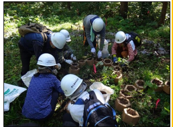
カミネッコンへの植え付け