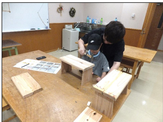
お父さんと一緒に製作中