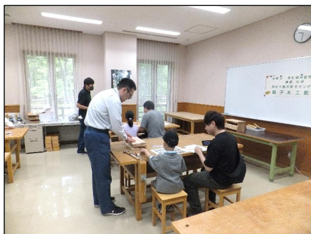
木工品の説明の様子

白神山地ビジターセンターふれあいデーは秋にもまた開催予定とのことから、木工教室を通して、心に残る、また満足していただけるように当センターでも秋の実施に向けた準備をしていけたらと思っております。