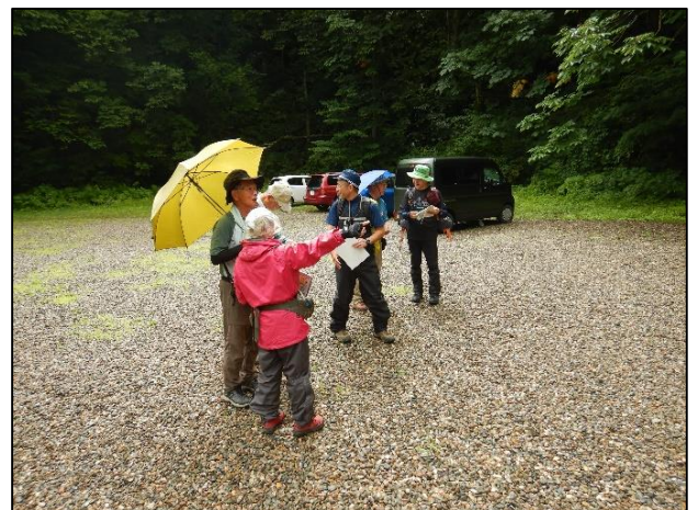
マナーパンフの配布

どのコースも小雨が降ったり止んだりの生憎の天気となりましたが、ブナ散策道コースには雨にもかかわらず、観光客が数多く訪れ 40