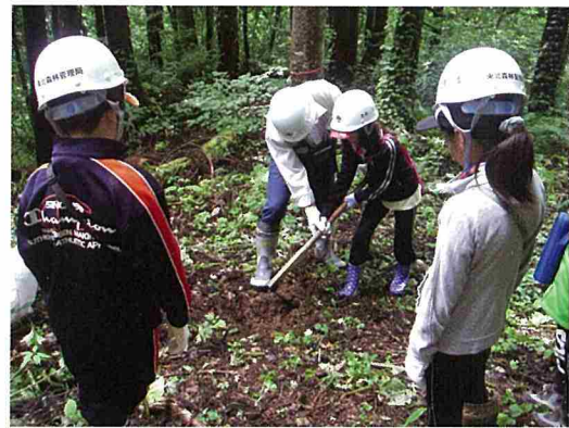
森林環境教育(小学生植樹体験)