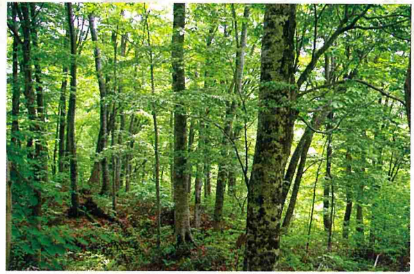
長期的目標の広葉樹林