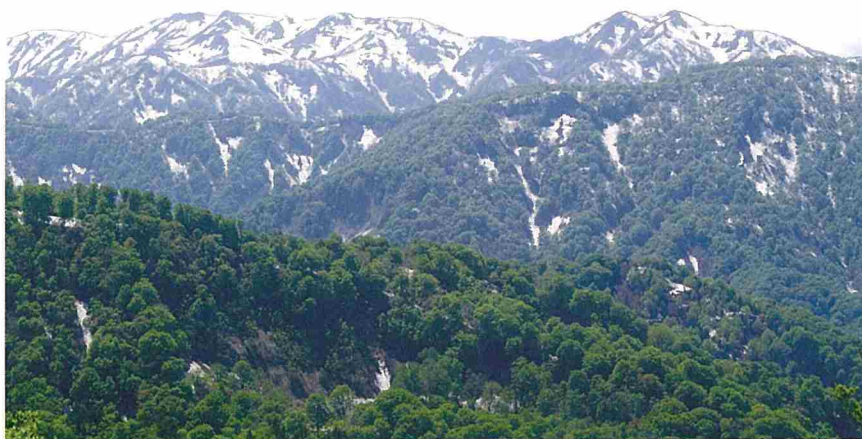
津軽峠からの向白神岳