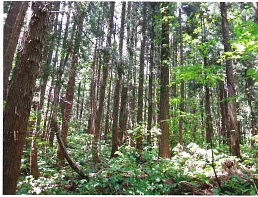
スギ人工林(自然再生拠点)