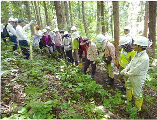
市民(一般公募)による自然再生活動

マップ) を策定しました。現在、これらの指針を基に関係行政機関、自然保護団体、NPO、学識経験者と連携して、白神山地周辺地域の森林空間利用タイプに分布するスギ人工林について、広葉樹林化等を図るなどの自然再生活動を実施しています。スギ人工林を広葉樹林化等していくには、100年単位の息の長い取り組みが必要ですが、地域住民やボランティア、企業など多様な参加を得ながら、生物多様性の向上やゆたかな地域づくりに貢献していくことが重要と考えています。