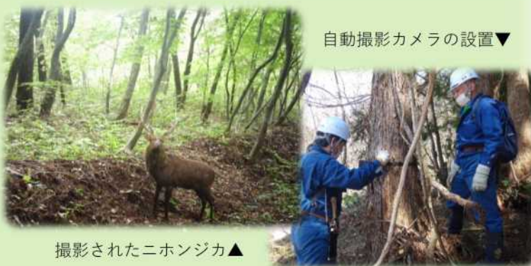
撮影されたニホンジカ▲

また、ニホンジカの食痕を調査し、DNAを利用して生育状況を把握するなど、監視業務に当たっています。