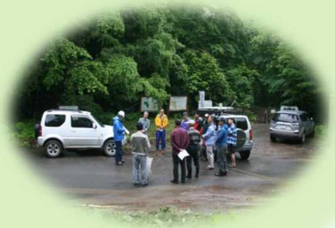
ボランティア団体に対する安全指導▲