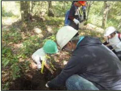
白神山地ビジターセンター活動での植樹指導

各種団体などによる植樹活動の技術支援や白神ラインの清掃活動など、各種ボランティア団体等と協力しながら、活動を行っています。