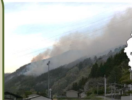
令和6年4月に宮古市で発生した山火事