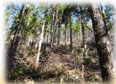
間伐して明るくなった林内 (森林整備事業)