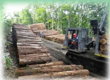
木材の生産・供給事業