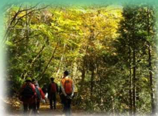
秋の五葉山森林浴ガイド (森林・林業普及活動)

林野庁東北森林管理局三陸中部森林管理署 世田米森林事務所について 世田米森林事務所は、平成四年に大船渡営林署 世田米担当区事務所を改称し、誕生しました。 住田町内にある六九五四ヘクタールの国有林野を 管轄しており、これは町内の森林のおよそ二三パー セントの面積を占めます。 国有林は、気仙川とその支流の上流に位置するこ とから、町内の豊かな水を支えるとともに、五葉山 周辺のヒバの天然林をはじめ、貴重な自然を保全す る場であり、木材の生産・供給の場としての役割も 果たしています。