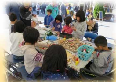
すみた産業祭り 木工教室 (森林・林業普及活動)