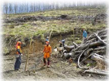
苗木の植え付けと 防鹿柵の設置・整備 (森林整備事業)