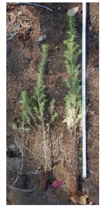
左から 35cm上 90cm 120cm の苗木