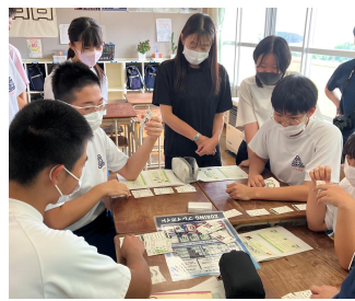
学びを深めるカードゲーム