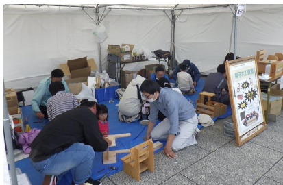
おおつち産業まつりで木工教室