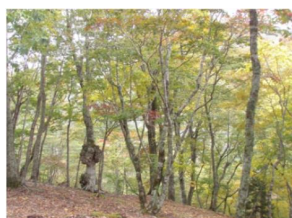
森林空間利用タイプ