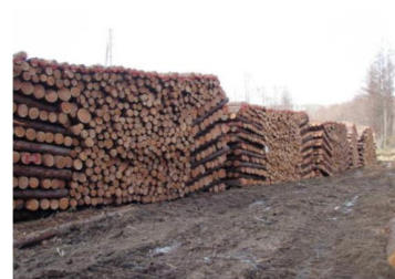
安定供給される国有林材