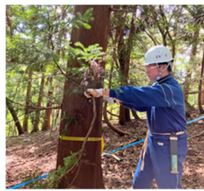
体験作業は安全第一