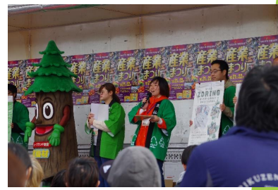
産業まつりでZORINGを紹介 (陸前高田市)