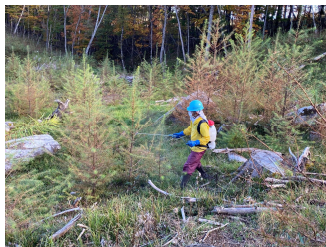
シカ食害対策剤の散布