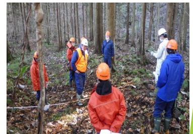
民有林行政との 地上レーザスキャナ講習会