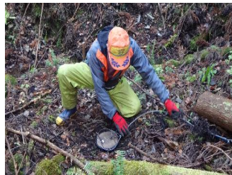
鳥獣被害対策協定に基づく くワナの貸出し