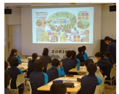
森林の循環の授業とZORINGの紹介