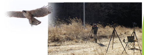
猛禽類の生息調査