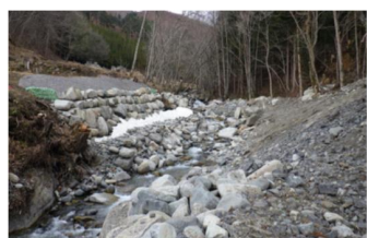
山地災害防止タイプ