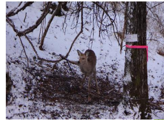
ニホンジカの誘引捕獲