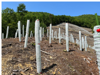
食害から守るチューブの設置