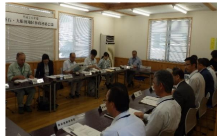
民有林行政との連絡会議