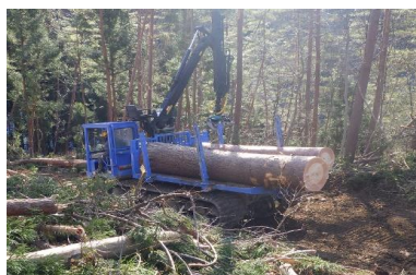
高性能林業機械を使用した 低コスト施業

地域の木材産業、木質バイオマス発電事業者を支えるため、林産物の持続的かつ安定的な供給に努めています。