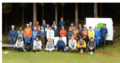
橋野鉄鉱山稼働時代の森づくり育樹祭

地域の森林の特色を活かした効果的な森林管理を目的とし、地域住民と協働・連携して森林整備を行います。