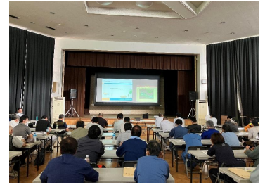
林業労働災害防止講話