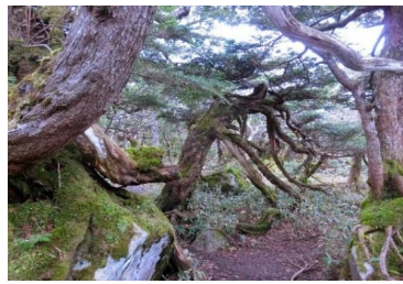
五葉山生物群集保護林のコメツガ林 (釜石市)

また、動植物の種の保存・遺伝資源の保全を図るため、「北上高地緑の回廊」を久慈市の平庭岳から大船渡市の毛無森山まで約150km設定しています。