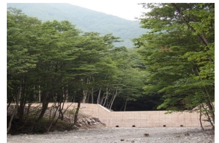
治山ダムと水源涵養保安林(釜石市)