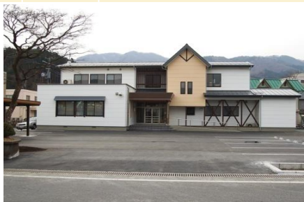
三陸中部森林管理署 庁舎全景(H20.2月完成)