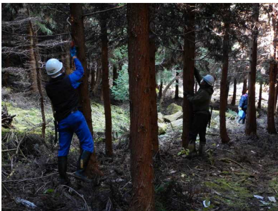
のこぎりによる枝打ちの様子