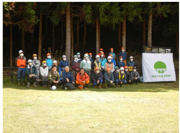
閉会式後の集合写真