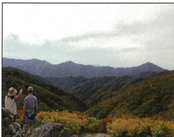
東北のマッターホルン「祝瓶山」を臨む