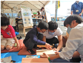
親子で巣箱づくり