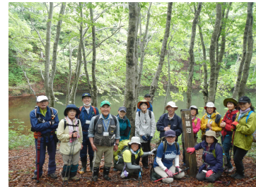
与蔵沼をバックに

前日の雨の影響からか多少肌寒さはあったものの、新緑の中「まぼろしの滝群」や「与蔵沼」において参加者それぞれが記念写真を撮るなど、自然に親しんだ一日となりました。