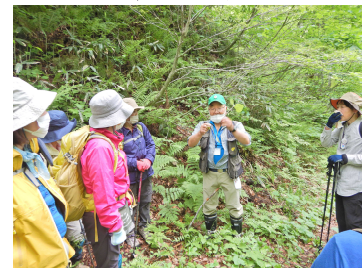
説明を聞く参加者の方々