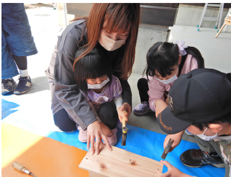
親子で巣箱作り体験

【5月4日（水）】「第49回真室川梅まつり」が真室川公園で開催されました。（昨年同様、規模を縮小しての開催です）当支署からもパネル展示のほか、巣箱作り体験コーナーを設置しました。