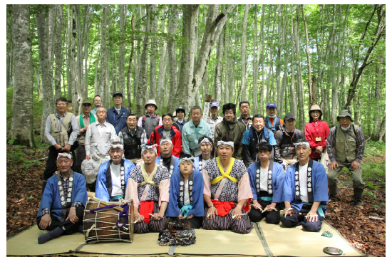
番楽の方々と全員で記念写真

【6月5日（土）】〈主催〉真室川町、同教育委員会、同観光物産協会「甑山山開きと甑山番楽奉納祭」が開催されました。登山開始前には、町の伝承文化でもある番楽奉納（釜淵番楽）が行われ、登山シーズンに向け安全を祈願しました。その後、男甑山山頂を目指す登山グループと、林野庁選定の「森の巨人たち100選」にも選ばれている「女甑山の大大カツラ」周辺をトレッキングするグループに分かれて行いました。参加された方々にとっては、伝承文化と自然に触れ合えた一日になったのではないのでしょうか。