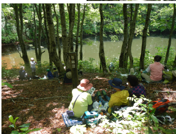
与蔵沼で 昼食休憩

【6月5日（土）】〈主催〉鮭川村観光協会、羽根沢温泉旅館組合「第27回まぼろしの滝・与蔵の森トレッキング」が参加者を山形県民限定50名までとして開催され、当支署職員3名もガイドスタッフとして参加しました。主催者及び最上支署長等のあいさつの後、バスで羽根沢登山道入り口まで移動しトレッキング開始です。当日は、天気にも恵まれ絶好のトレッキング日和となり、爽やかな風と新緑の中「まぼろしの滝群」や「与蔵沼」において参加者それぞれが記念写真を撮るなど、自然に親しんだ一日となりました。（最後は羽根沢温泉に浸かり、一日の疲れを取りました♪）