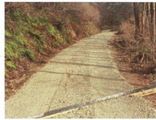
牛蒡根沢林業専用道(最上町)

このため、最上支署では、引き続き、林業専用道をはじめとする路網の整備を進め、安定的な木材供給に努めることで、地域産業の振興に貢献してまいります。