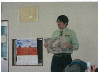
首席森林官による講演の様子