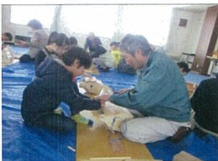
巣箱づくりを行う子どもたち

参加した子どもたちは、巣箱に入る鳥を思い浮かべながら楽しそうに取り組んでいました。