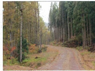
小牧森林業専用道(最上町)