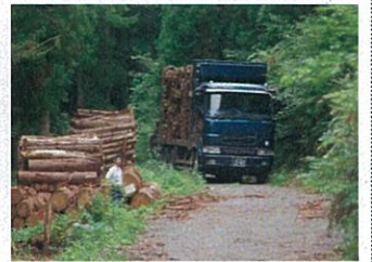
刃場川林業専用道(最上町)