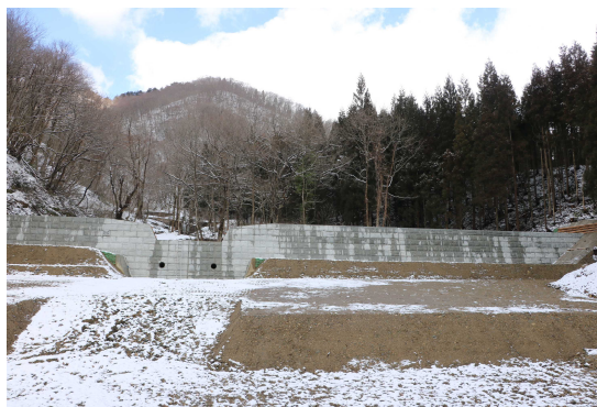
↑大沢No.2 コンクリート谷止工 7同No.1 堤名板

地域の安全・安心を確保するため、最上支署では今年度も災害からの復旧を推進します。