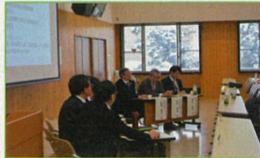
パネラーの皆さん