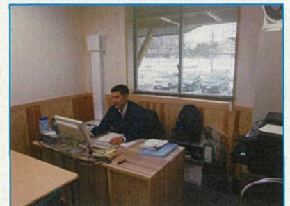
森林官補も楽しそう！