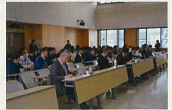
真剣に聞いています