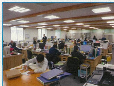
明るくきれいな事務室で仕事も捗る？